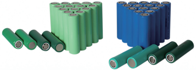
高比能量三元圓柱型鋰電芯