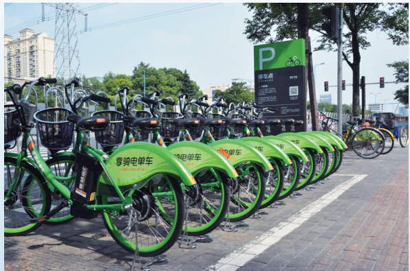
在上海投放的享騎共享電單車主要用天能電池