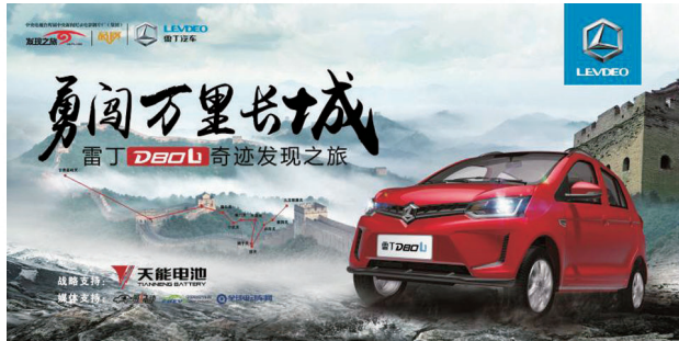
天能電池助力雷丁電動車勇闖萬里長城

集團研發推出的衡科技，通過六大均衡，使電池內各活性物質能夠發揮最佳反應效果，提高電池壽命。衡科技已獲國家專利認可並通過國際PCT標準認證。集團稀土矽膠電池、鉛碳電池、真黑金電池、精品電池、衡電池一系列，實現全型號、全功能產品覆蓋。同時，新增了工業電池、儲能電池、啟動啟停電池生產設備，擴大了鉛電池的應用推廣領域。