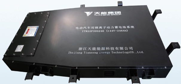
高安全性新能源汽车鋰電池包