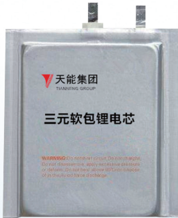
大功率三元軟包鋰電芯

國家對鉛蓄電池行業實行規範管理、鼓勵行業健康有序發展。截至本報告期，國家工信部公佈三批共113家企業符合《鉛蓄電池行業規範條件》。國務院常務會議確定取消蓄電池事前生產許可，按照國際通行規則實行強制性認證（CCC認證）。行業門檻進一步提高、產業集中度進一步加強、整合紅利進一步釋放。