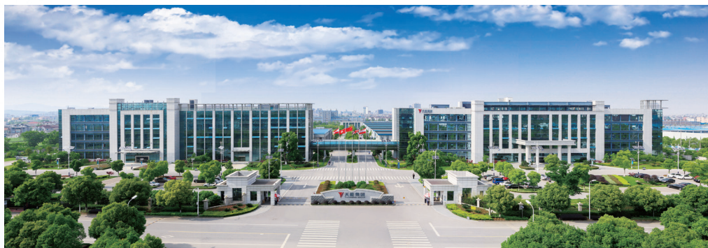
(本集團鋰電池生產基地)

2017年2月中國化學與物理電源行業協會發佈的《2016年度中國動力鋰離子電池20強企業名單》，本集團的三元材料動力鋰電池銷售量位居中國第四名。集團鋰電池業務成為行業內唯一一家進入工信部「2017製造業與互聯網融合發展試點示範項目」的企業。同時，牽頭參與中國電器工業協會《鋰離子電池綠色設計產品評價團體標準》的制定。