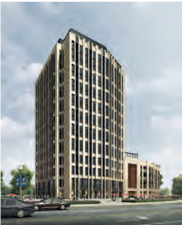
廊坊北辰奧園新城商業效果圖