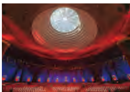
北京雁栖湖國際會展中心

會展研發方面，公司憑藉在會展行業多年的實踐與研究經驗，已成功為北京市朝陽區商務委、珠海市商務局等政府部門提供政府智庫、戰略諮詢服務；會展主承辦方面，公司積極籌備中國武漢遊戲節，持續向會展產業鏈上游進發；品牌經營擴張方面，依託北辰會展的品牌影響力及技術軟實力，公司進一步實施「走出去」戰略，加快會展場館拓展、酒店品牌的經營和管理輸出，現已逐步形成了以受託管理為核心的多元化服務盈利模式，以及全國化、多城市延伸擴展的戰略佈局。報告期內，北辰會展集團成功簽約北京銀豐北辰五洲皇冠酒店、大同北辰五洲皇冠行政公寓2個項目的受託管理和南通國際會展中心、西安滄灑生態區絲路國際會展中心、赤峰旅遊綜合服務管理中心酒店以及珠海國際會展中心(二期)設計優化工程4個項目的顧問諮詢。截至報告期末，已進入全國21個城市，累計已簽約的顧問諮詢及受託經營的會展與酒店項目達到了25個，實現受託經營管理總建築面積近185萬平方米。