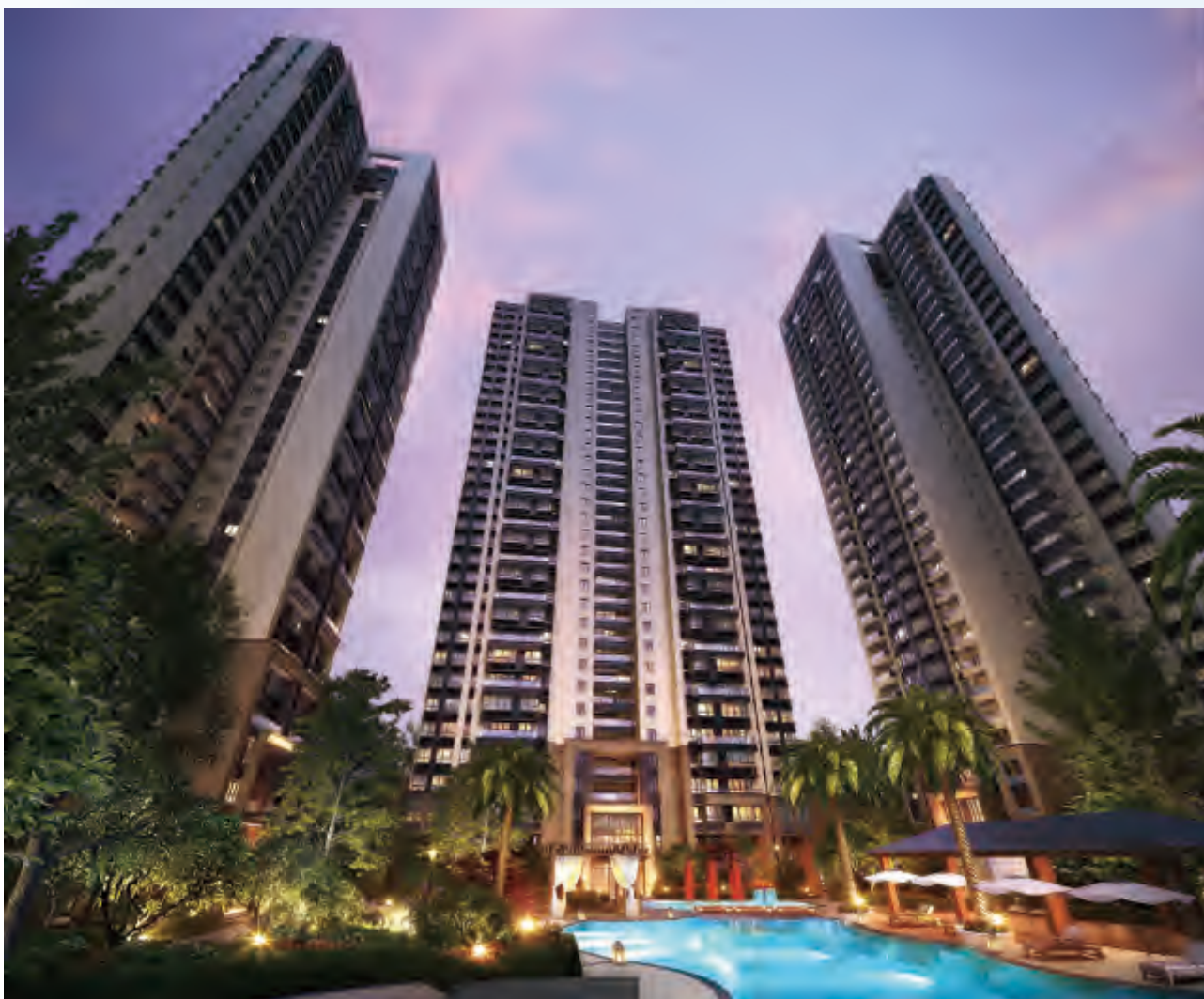
北辰·南湖香麓高層效果圖