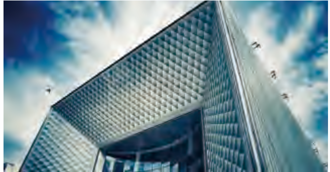
武漢北辰光谷里建築實景