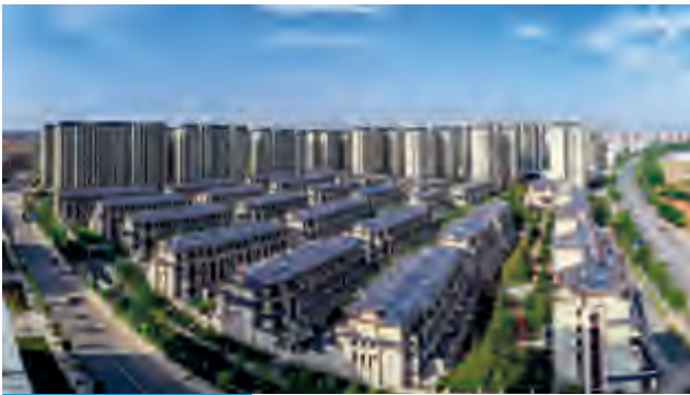
長沙北辰中央公園