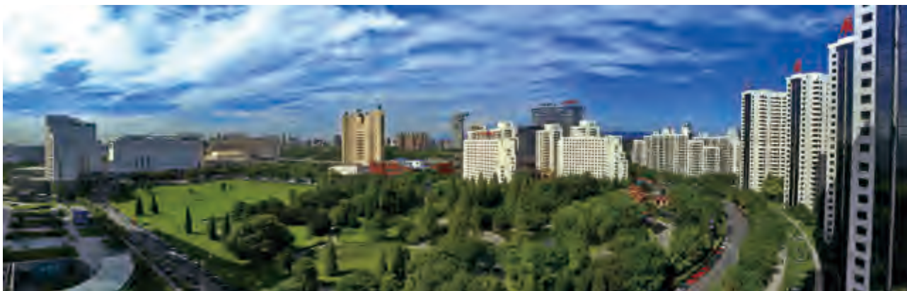
亞運村綜合物業群

二零一七年上半年，面對不斷變化的市場和政策形勢，公司以「建設全國一流的複合地產品牌企業和全國最具影響力的會展品牌企業」的戰略目標為指引，深入實施低成本擴張、品牌擴張和資本擴張三大戰略，通過加強對新形勢下行業特點和市場趨勢的研究，準確把握市場機遇，積極採取靈活有效的運營策略，公司經營規模和效益水平持續提升。二零一七年上半年，公司房地產項目可結算面積增加，實現營業收入人民幣785,274.7萬元，同比大幅上升78.61%。除稅前利潤和所有者應佔利潤分別上升60.26%和38.28%，為人民幣142,938.1萬元和人民幣77,200.6萬元，公司稅後主營業務核心經營業績（不含公平值變化收益）為人民幣69,242.6萬元，同比上升48.05%。本期投資物業公平值變動收益（稅後）為人民幣7,958.0萬元。每股溢利為人民幣0.23元，較同期上升38.28%。