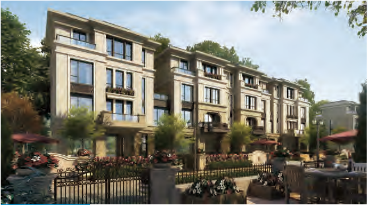
北辰朗詩·南門綠郡效果圖