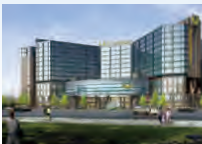
張家口北辰五洲皇冠酒店