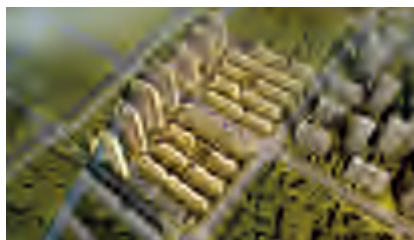
無錫辰萬項目鳥瞰效果圖