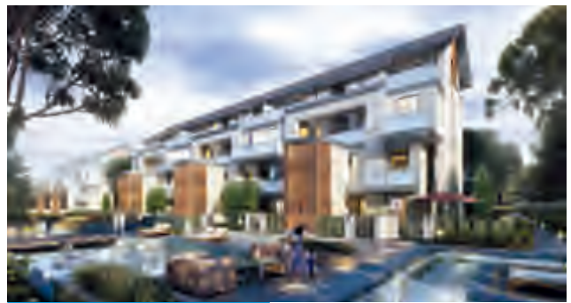
蘇州吳中項目疊拼效果圖