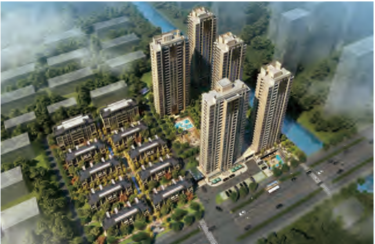
杭州北辰國頌府鳥瞰效果圖