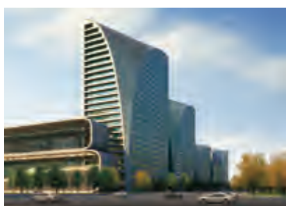
杭州國際博覽中心