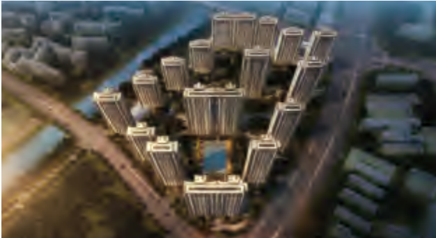
寧波北辰府鳥瞰效果圖