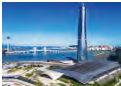
珠海國際會展中心