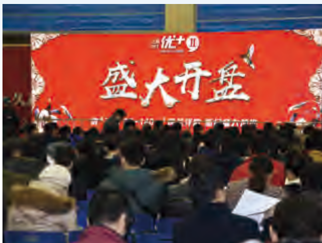
武漢北辰優+二期開盤現場

在銷售方面 ，面對宏觀調控愈發趨緊的形勢，公司緊密結合市場行情變化，不斷優化體系建設、創新營銷策略，強力推進快週轉戰略實施，報告期內銷售業績穩居全國地產百強行列，現金回籠率達到105%。其中，北辰三角洲項目依託於長沙市級文化配套「三館一廳」的投資建設，以及地鐵、城鐵、公交等多重立體的便捷交通體系，已成為集商務、居住、休閒、文化為一體的中國最大城市綜合體，自開盤以來連續六年獲得長沙市銷冠。報告期內實現銷售面積13萬平方米，銷售金額人民幣21億元。該項目自開盤以來累計實現合同銷售金額超過人民幣200億元，現金收入人民幣203億元，累計實現開工面積391萬平方米、竣工面積276萬平方米，分別佔總建築規模的75%和53%。此外，公司其他區域的在售項目也均保持熱銷態勢。