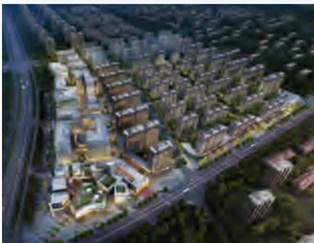
武漢北辰蔚藍城市鳥瞰效果圖