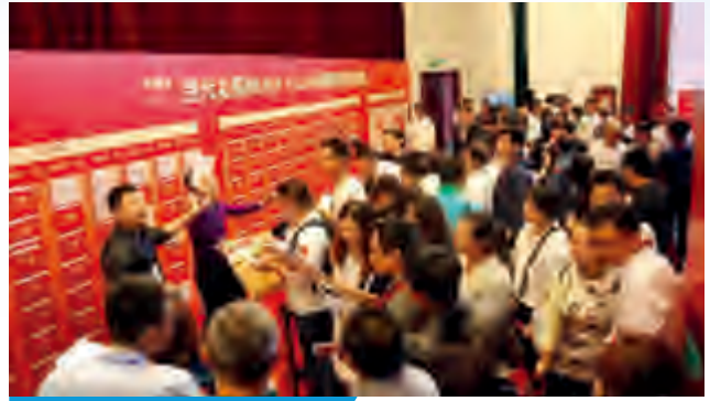
北辰當代悅MOMA開盤現場