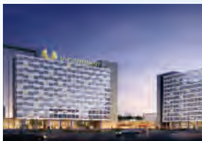
山東泓任北辰五洲皇冠酒店