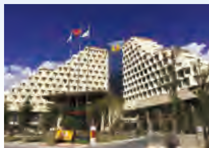
林芝五洲皇冠酒店