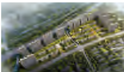
無錫洋溪河項目鳥瞰效果圖