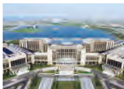
連雲港大陸橋會展中心