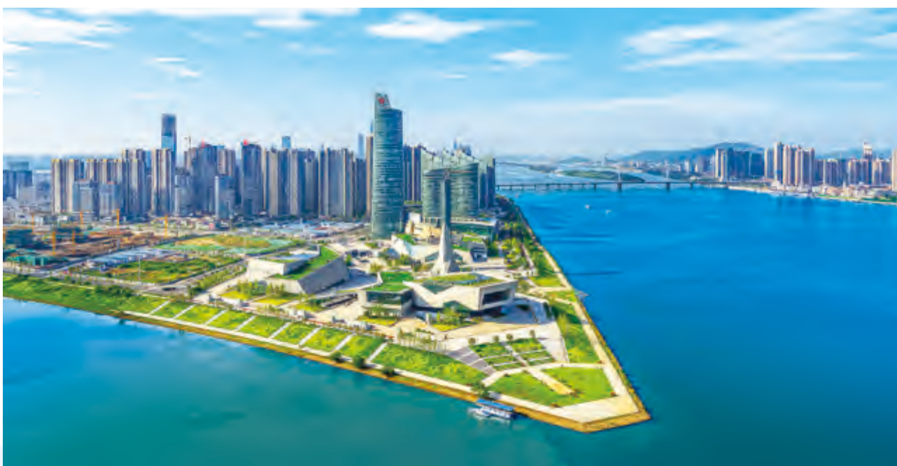
長沙北辰三角洲全景