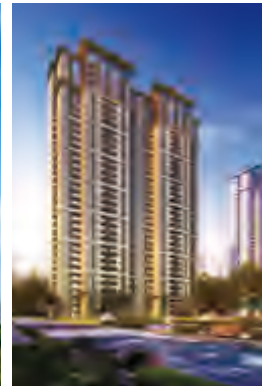
杭州北辰奧園效果圖

在投資方面 ，公司持續關注經濟發展前景好、市場發育程度高、人口淨流入的重點城市，積極尋求招拍掛、收購及合作開發等方式，擇機增加土地儲備，報告期內，公司取得位於無錫的3宗土地，新增土地儲備約82萬平方米。截至報告期末，公司已進入北京、長沙、武漢、杭州、成都、南京、蘇州、合肥、廊坊、重慶、寧波、無錫等12個城市，總土地儲備917萬平方米，共有擬建、在建項目32個，規劃總建築面積1,600餘萬平方米，形成了華北、華中、華東、西南等多板塊聯動佈局。