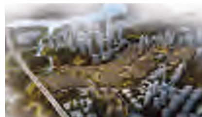
重慶北辰悅來臺號效果圖