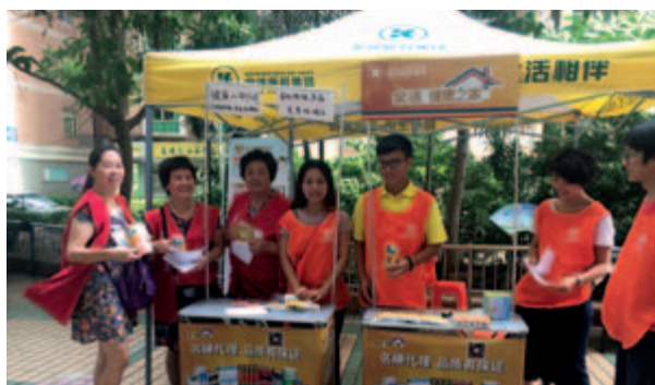
不倒翁關愛項目金活使者進深圳田心社區

未來，本集團也將與金活關愛健康基金會聯合深圳晚報、ZAKER等媒體以及健康部落等民間NGO組織，繼續舉辦「金活健康使者進社區」系列關愛活動，尤其是關愛肌肉、關節、頸肩腰腿痛人群，在全國近百個城市招募金活健康使者，把慰問和關愛送到全國各大城市各個社區，向關愛對象提供飛鷹活絡油、金活依馬打正紅花油、和興白花油及曼秀雷敦薄荷膏等外用藥物按摩拭擦服務。希望在為人們提供健康服務的同時，從社區發展角度，普及健康生活、優化健康服務、傳遞健康理念、建設健康環境，以實際行動助力健康中國，助力全民大健康。