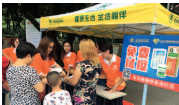
「金活健康使者進社區」系列關愛活動現場