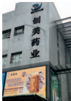
正露丸-創美藥業大樓總部牆體廣告

金活依馬打正紅花油因生產廠家GMP改造等原因曾斷貨一年多，市場翹首以盼，自六月份上市始，供不應求、瞬時訂空。本集團抓住分銷商銷售活動的良好機會，將制訂好的營銷策略迅速推廣，建立與各分銷商和零售終端的合作關係，開展消費者教育活動，提升品牌知名度，於報告期內錄得良好銷售。未來，本集團將大力執行渠道分銷和終端獎勵活動，以提振分銷、快速實現廣大終端的鋪貨上架，同時加強與全國百強連鎖合作，迅速鋪市，以期儘快恢復市場份額，重新奠定其外用藥油領導者身份。