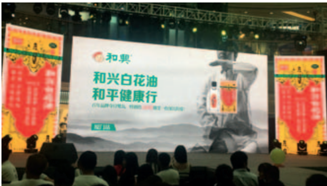
和興白花油於中國之推廣活動

本集團新代理的和興白花油於本報告期內的銷售額較二零一六年同期增長54.7%，與飛鷹活絡油、金活依馬打正紅花油互為補充，成為本集團外用油系列又一強力支撐。於本報告期內，白花油迎來上市九十周年大喜之年，本集團充分利用其於重點市場的品牌影響力，持續加大鋪貨及不斷挖掘銷售潛力，利用九十周年為切入口策劃了系列品牌活動，加大品牌推廣、品牌教育及消費者互動活動，並參與了白花油九十周年健康中國行杭州站、廈門站等各類品牌活動，從而提升了產品品牌影響力及美譽度。