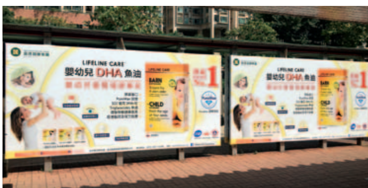
香港粉嶺華明公轉站

本集團自二零一六年成功獲得挪威 Lifeline Care 魚油營養素系列產品的大中華地區獨家代理權以來，為該品牌產品度身制定了相應的市場推廣及產品運營方案，借助本集團成熟的分銷網絡和產品經營策略，該品牌產品快速突破線上市場，且亦成功登陸香港、澳門地區線下的萬寧、母嬰店及連鎖藥房零售門店等。同時，本集團亦於線下和線上多元化平台大面積投放了產品廣告，如人流密集的地鐵站、巴士站、通關口岸，紙媒、母嬰專業門戶網站以及社交媒體等，從而有效樹立了品牌認知度，為產品的市場擴展及銷售增長奠定了重要的品牌基礎，使該產品系列取得了良好的銷售開端。於本報告期內，該產品快速增長，銷售良好。此外，隨著中國母嬰健康市場需求的逐漸擴大，作為挪威銷量第一且具有高於歐盟嚴格標準的魚油品牌，Lifeline Care 魚油營養素系列產品有望繼康萃樂後成為本集團又一主打新產品。