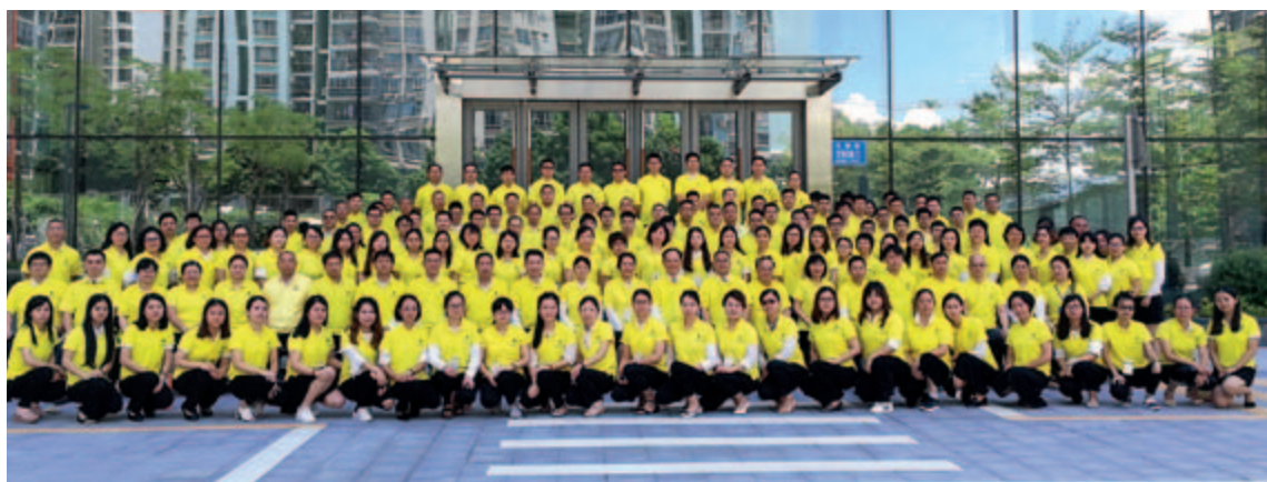
二零一七年中營銷大會

本集團重視人才培訓，積極鼓勵員工自我增值，終身學習。為此，本集團已制定一套完善的員工發展及培訓制度，每年集團商學院會根據部門及員工需要提出培訓需求，並根據業務發展及工作安排，統籌落實各級人員的在崗培訓，以提升工作技能。例如本集團積極開拓網絡銷售管道時，特別需要相關的員工掌握網絡營銷方面的知識和技能，因此商學院通過在線及線下相結合的模式，推出定期的培訓，以及不定期的進修，讓員工加強熟知產品知識、掌握政府政策及提升銷售技能等。另外，每年集團還舉辦多次營銷大會、主題會議、專題學習、行業交流學習講座、崗位實習、主題比賽活動、室外拓展活動及文化活動等，涵蓋各專業技能、職業崗位、職業素養等，員工須按其需要參加。