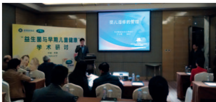
康萃樂參加天津兒保協會