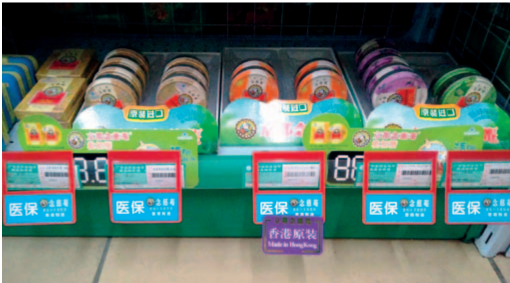
京都念慈菴枇杷糖之陳列

第一大支柱型傳統產品京都念慈菴蜜煉川貝枇杷膏於報告期內專注於百強連鎖及區域連鎖的合作，並通過新媒體傳播來吸引年青消費人群的喜好，在鞏固原有一、二線城市的恢復性銷售增長外，加速佈局三、四線城市的覆蓋，重新提升斷貨期間失去的市場影響。於本報告期內京都念慈菴蜜煉川貝枇杷膏錄得的銷售量與去年同期相約。