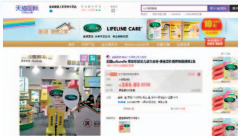
康萃樂於天貓國際海外專營店