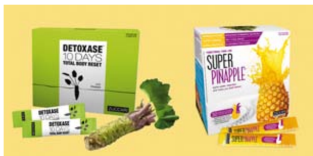
意大利 Zuccari 濃縮瘦身果汁

全球瘦的另一款產品——意大利 Zuccari 濃縮瘦身果汁已經可以銷售，本集團將通過深化與原有各大電商平台、分銷渠道的合作，與網易考拉、唯品會等新的大型渠道建立合作機制，成為其減肥品類戰略性客戶，為 Zuccari 濃縮瘦身果汁迅速上市及引發爆點提供保障，同時通過新媒體傳播助力銷售。