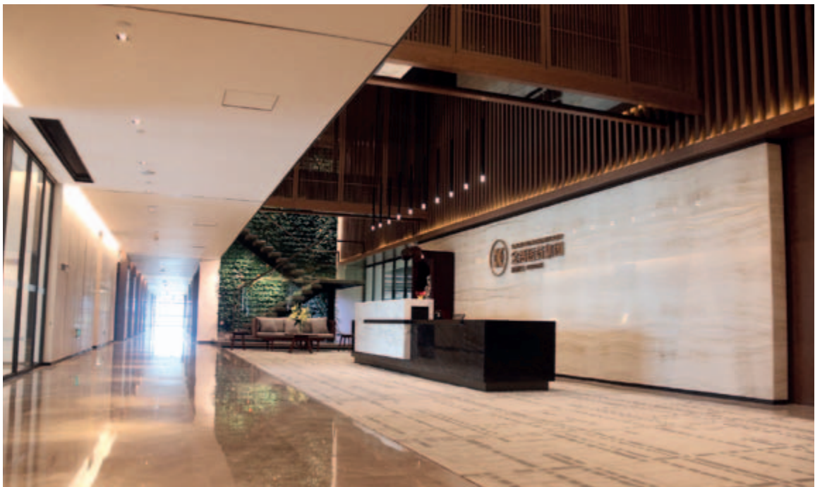
金活醫藥集團辦公環境

為了營造更好的工作環境，吸引及留住人才，於報告期內，本集團入駐南山總部經濟大廈一馬加龍創新大廈，面積逾5,000平方米，該設計曾獲新加坡室內設計師協會(SIDS)頒發首屆新加坡室內設計大獎(SIDA)銀獎(Silver Award)。寬鬆的辦公區域，富於現代設計感的交流區及多個會議室等為員工提供了工作舒適、便利的同時，更激發了員工的創新思維及團隊的合作。