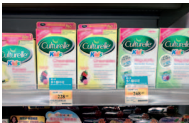
香港萬寧銷售陳列

相比醫藥線規範的管理，母嬰渠道的終端仍處於零散、各自為政、無全國龍頭零售的現狀，但正向全國連鎖和區域連鎖的道路邁進。特別是對於一、二城市來說，連鎖門店由於良好的地理位置、高素質及專業的店員服務、有品質保證的產品及售後服務，良好的購物環境及會員管理等倍受80後及90後媽媽們的喜愛，連鎖化發展也是未來的發展方向。故此，於本報告期內，本集團已經和諸如樂友等有影響力的母嬰連鎖確定了合作關係，並制訂了相關的推廣策略來提升銷售。為加快佈局多元化終端網絡，已經進入了一些高端的個人護理店及營養保健品專賣店，如屈臣氏、萬寧、華潤堂國內店等。