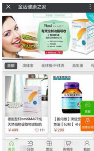
金活健康之家微商城

於報告期內，本集團已經啟動了前海跨境電商新平台的開發，未來將加速推動金活健康之家前海跨境電商平台的成功上線及正式運營。