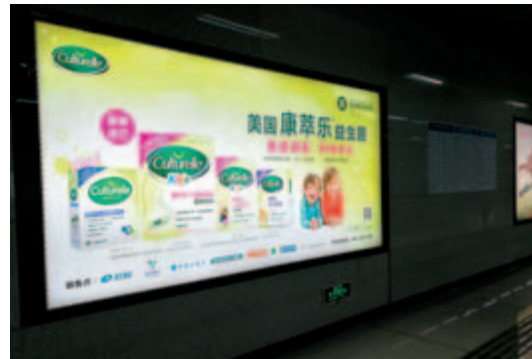
康萃樂地鐵燈箱廣告