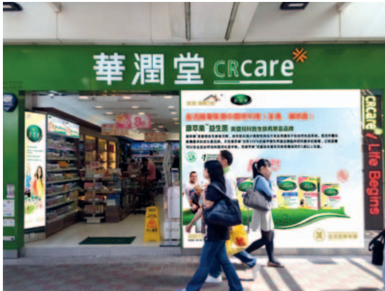
康萃樂 - 華潤堂

未來，本集團將繼續積極拓展康萃樂益生菌系列產品所覆蓋的跨境電商分銷、自營平台及線下醫藥線和母嬰線KA門店的拓展，並以康萃樂成人粉劑上市為切入點，推動康萃樂在KA體系及線下渠道全品類的發展，使康萃樂產品在線下覆蓋的終端數量達幾萬家以上，以進一步發揮品牌的市場競爭力，為更多的家庭提供健康服務。