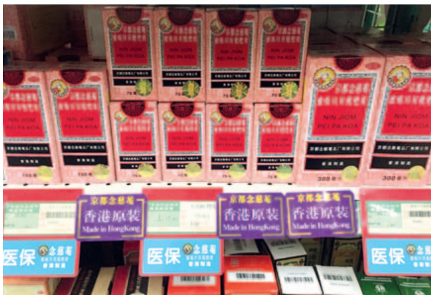
京都念慈菴蜜煉川貝枇杷膏之陳列

為了提升京都念慈菴枇杷糖的銷售，本集團制訂了與京都念慈菴蜜煉川貝枇杷膏的組合營銷策略，例如銷售陳列競賽等多種形式的營銷模式，策劃了大學校園歌手比賽、試吃等多種公益活動，在回饋社會的同時，讓更多的消費者見證京都念慈菴品牌的影響力，產品的質量和企業的社會責任。於本報告期內，京都念慈菴枇杷糖錄得的銷售量與去年同期相約。