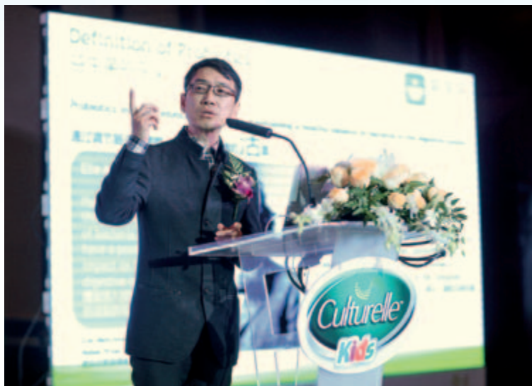
與崔玉濤育學園合作參加中美益生菌高峰論壇