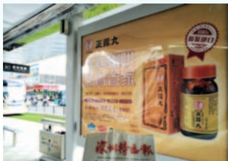
深圳龍華有軌電車站台廣告