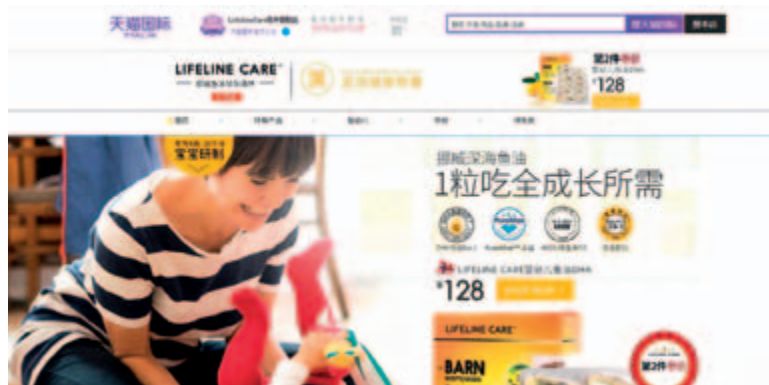
Lifeline Care 天貓海外旗艦店

憑藉著豐富的優質產品組合及良好的電商平台運營拓展經驗，本集團緊跟政策腳步，在積極加強對已有線上平台的管控及銷售推廣力度的同時，結合自身不斷豐富的健康產品組合，進一步開拓了新的電商平台。持續完善渠道等級化管理、多元化產品上架、線上貨源及價格管控、推廣營銷、售前售後服務、會員管理及服務等運營策略，並進一步實現與網易考拉、阿里健康、亞馬遜等重點電商平台達成戰略合作，實現了旗下產品線上、線下相互協同的全方位戰略佈局，有效推動了產品銷售的增長。同時，本集團抓住微商所帶來的機遇，建立了微商城，專注於公司所經營的健康產品，並取得一定效果。截至二零一七年六月三十日止六個月，本集團跨境電商業務增長迅速，銷售額較去年同期大幅增長92.4%。