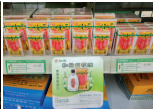
和興白花油之陳列