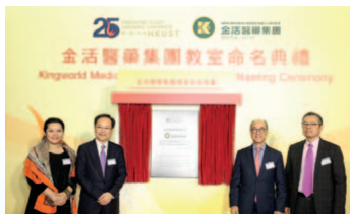
金活醫藥集團階梯教室命名典禮

於本報告期內，香港科技大學為感謝本集團向其捐贈350萬港元用於學生交流及中醫藥研發，因而將李兆基商學院一階梯教室命名為金活醫藥集團教室，該教室已於二零一七年一月舉行揭幕儀式並供學生使用。此外，本集團及金活關愛健康基金會聯合健康部落、安瀾義工等組織開展不倒翁關愛項目，為老年人提供關愛健康服務；並聯合廣州醫藥為貴州省織金縣自強鄉大沖小學愛心助學，捐贈健康藥包；亦通過無錫農工黨組織為甘孜藏民送健康，以及通過香港陽光天使義工團向香港社區獨居老人饋贈健康禮包開展關愛老年人健康公益活動。