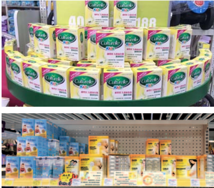
香港母婴店陳列銷售