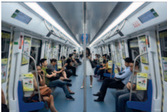
康萃樂廣州地鐵專列

線下渠道和傳播為本集團潛力經營二十幾年的市場，於本報告期內，本集團重視線下推廣和品牌提升。例如康萃樂益生菌在上海、廣州、深圳等地鐵進行了專列展示，於本報告期內傳播覆蓋多達2,000多萬人次；康萃樂亦與中國關心下一代工作委員會兒童發展研究中心合作，加入到中國母嬰萬里行大型公益活動中，報告期內已在13個城市進行16場線下品牌推廣、兒童養護知識講座。此外，本集團還與國內權威兒科醫生崔玉濤育學園合作，參與科學育兒巡迴演講，通過這些全國各地的育兒活動，把科學的育兒養育方法傳遞給母嬰家庭，同時也把優質的產品帶給消費者體驗，鼓勵其分享，從而贏得口碑。