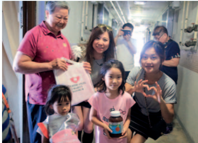
香港陽光天使義工團饋贈健康禮包

深圳市民政局於六月公佈的《二零一六年度深圳慈善捐贈榜》顯示，集團旗下深圳市金活醫藥有限公司與騰訊控股有限公司及萬科企業股份有限公司等企業一起上榜，位列第17位；深圳市金活關愛健康基金會在該社會組織捐贈收入排行榜上亦榜上有名，位列第104位。於報告期內，本集團還取得了深圳知名品牌、深圳健康產業領軍企業、深圳健康產業社會責任企業、二零一四至二零一六守合同重信用企業等榮譽。