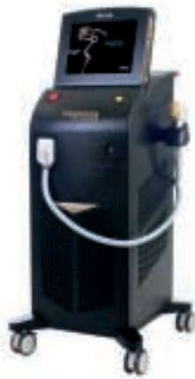
Soprano Ice Platinum