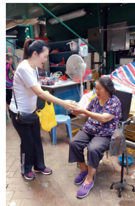
銀娛義工在颱風天鴿襲澳後翌日，向有需要人士派發食物和瓶裝水