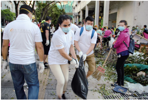
在颱風吹襲過後清理街道上的垃圾