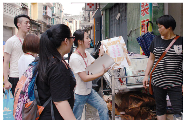
持續動員義工重建社區，向社會各界人士表達關愛和關懷