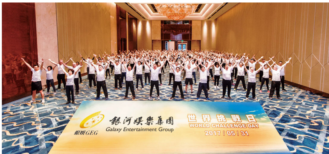
超過200名管理層及員工響應「世界挑戰日」，齊集於澳門JW萬豪酒店宴會廳進行15分鐘健身操