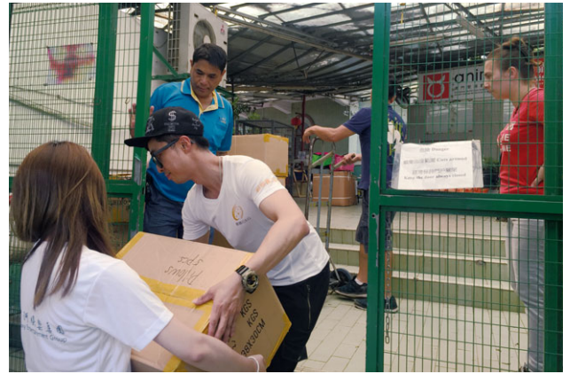
捐出多箱毛巾，幫助家園被颱風天鴿摧毀的小動物