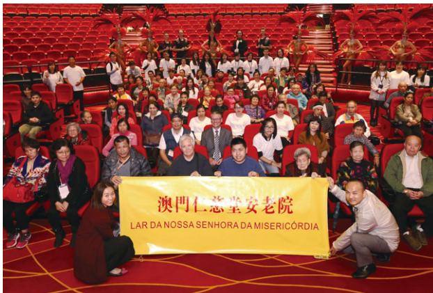
銀娛邀請了約80名來自澳門仁慈堂安老院的長者及仁慈堂盲人重建中心的會員前往「澳門百老匯™」欣賞精彩娛樂表演《百老匯奇幻秀》

銀娛秉承「取諸社會，用諸社會」的精神，繼續積極投身社區服務。二零一七年上半年，近170名銀娛員工參加了我們的義工活動，為超過620名弱勢人士和低收入的家庭提供協助。