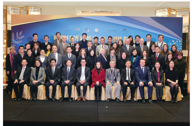
銀娛定期舉辦內部宣傳活動及參與社區活動，以協助教育及支持負責任博彩