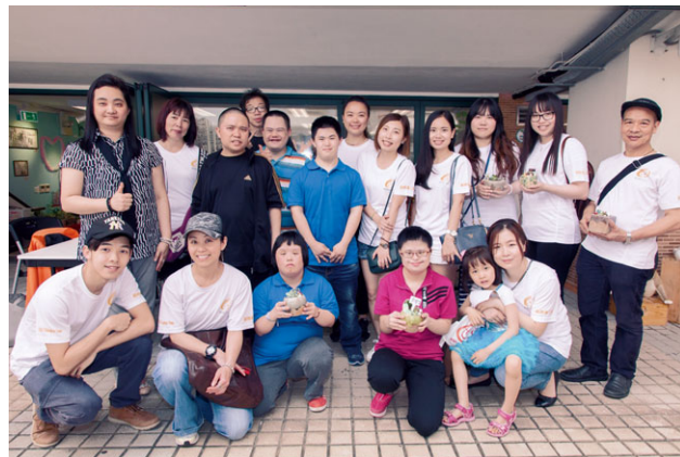
銀娛義工在澳門扶康會的南灣•雅文湖畔「悅畔灣Happy Shop」與該會學員一起參加「盆景親子工作坊」