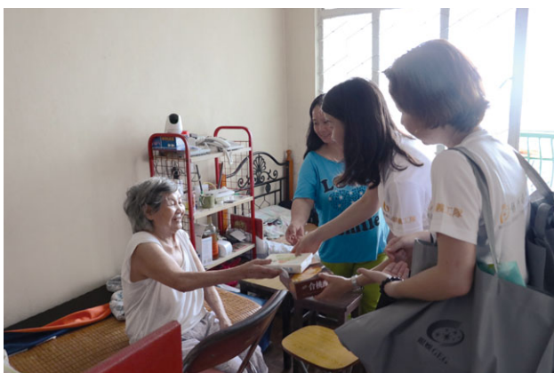
探訪家中缺水缺電的長者，為他們送上緊急救援物資