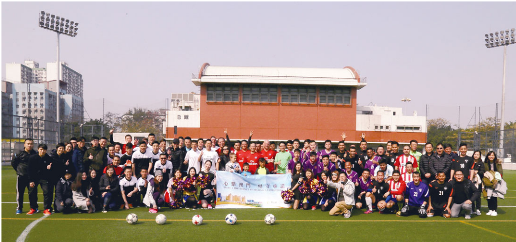
為宣揚作息平衡的訊息和提升團隊凝聚力，「銀娛員工康樂會」第四年舉辦「銀娛足球賀歲同樂日」，吸引了120名員工及其家屬參與

上半年，銀娛舉辦了接近360項培訓課程，供大約14,950名員工參加。此外，為持續提升團隊的凝聚力，「銀娛員工康樂會」舉辦了16項不同的體育及康樂活動，參加的員工和員工家屬超過1,250人。