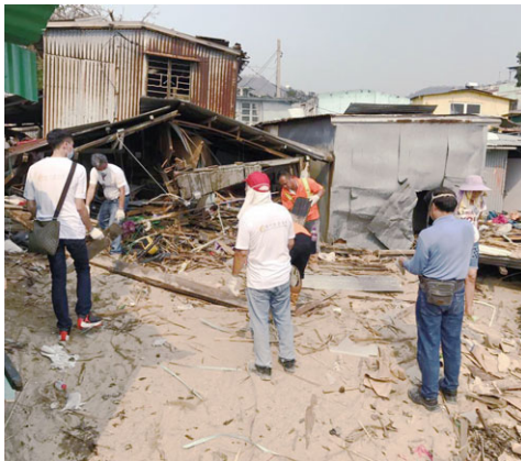
清除倒塌的房屋部分以及家居維修，幫助受災家庭重建家園