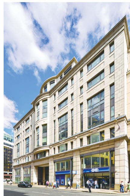
33 Old Broad Street, London

與賣方協定之最終代價為258,169,018英鎊，調整金額為8,350英鎊。據此，有關最終代價之最高適用百分比率(按上市規則第14.07條計算)低於25%。因此，該收購事項仍然為本公司之一項須予披露交易。