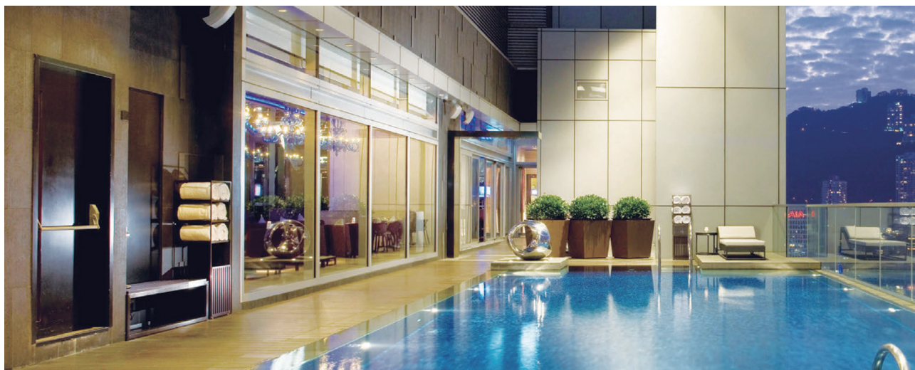
香港銅鑼灣皇冠假日酒店，香港

本人欣然向股東提呈本集團截至二零一七年六月三十日止六個月之未經審核簡明綜合財務業績。