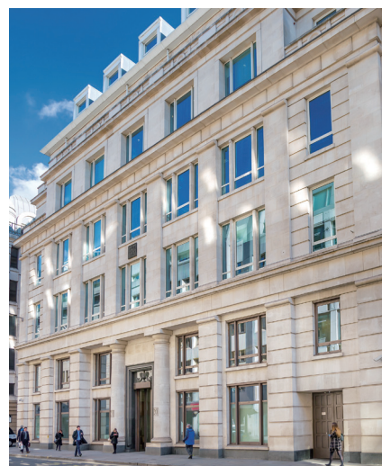
20 Moorgate, London, EC2R 6DA, England

展望未來，我們將繼續物色具增長前景及經常性收益穩定的投資對象，以提升盈利能力。同時，本集團將繼續持守審慎的財務管理方針，維持穩健的債務比率，並秉承本身的增長策略，盡力為股東帶來最大回報。