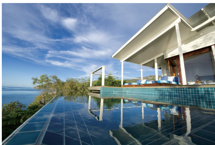
Lizard Island Resort, Queensland

香港銅鑼灣皇冠假日酒店為樓高29層及提供263間客房及配套設施之五星級酒店，並由洲際酒店集團管理。該酒店業績較二零一六年平穩，此乃酒店業務市場疲弱(惟被期內執行之節省成本措施所抵銷)所致。該酒店將致力於進一步擴大市場佔有率，並於充滿挑戰的市況下改善資產管理。