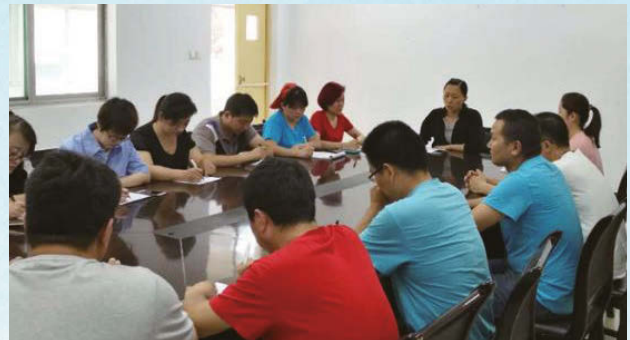
員工參加三級培訓

為維持企業生產經營順利進行，本集團認真貫徹「安全第一，預防為主，綜合治理」的方針，定期識別安全教育培訓需求，制定和實施各類人員的培訓計劃，並對培訓效果進行評估和改進。例如，本集團定期對管理幹部進行安全知識、操作規程、安全法規、逃生自救等方面的培訓教育；對新員工開展安全教育三級培訓；對從事特種作業的人員進行培訓並取得資格證書。