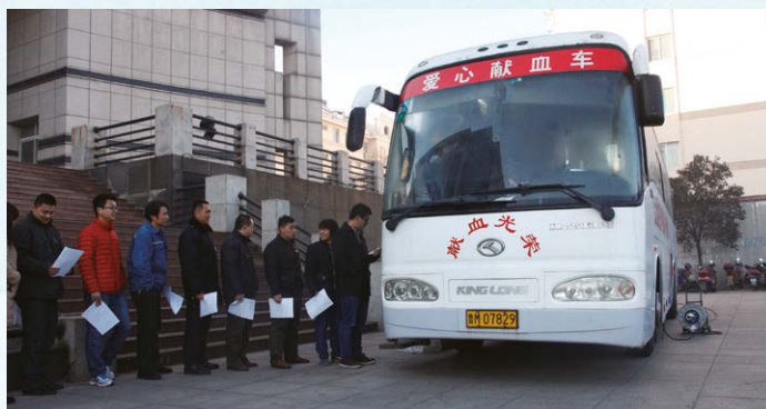
員工積極參加無償獻血