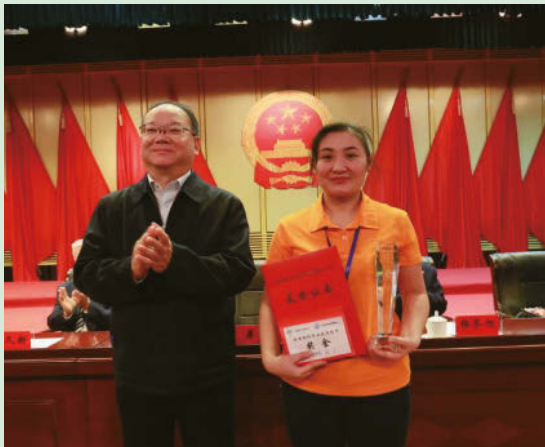
中國紡織工業聯合會黨委書記為大賽第一名頒獎

為迎接此次大賽，本集團生產技術部制定了詳細的培訓練兵方案。培訓分四個階段，第一階段為子公司內部選拔，第二階段為集團選拔賽，第三階段為集團集中培訓，第四階段為參加全國大賽。培訓本著「全員培訓、層層選拔」的原則，理論採取集中培訓、集中測試的方式，由車間操作員授課，達到全面掌握《棉紡織行業細紗工操作指導》內容的目標；實踐採取分頭培訓、集中測試的方式，通過觀摩交流，使員工單項、全項操作方法不斷改進，操作水平不斷提高。