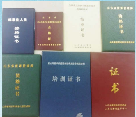
能源管理師資格等證書