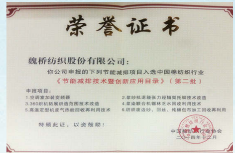
入選節能減排技術暨創新應用目錄