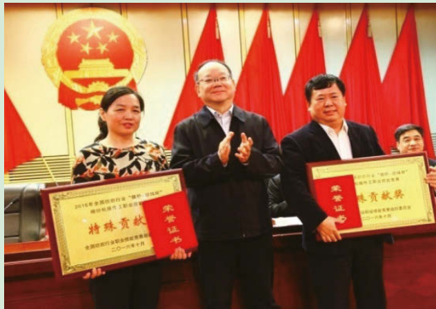
魏橋紡織榮獲特殊貢獻獎

本集團注重培訓平台的建設和完善，充分利用母公司魏橋創業的媒體資源，通過「魏橋創業電視台」、《魏橋創業報》及微信公眾平台對員工進行培訓和教育，並自行編製培訓教材。例如，每季度編製一期《基層管理人員培訓教材》，以理論結合案例的形式，指導基層管理人員如何建設優秀的隊伍，發揮團隊最大效能；編製《班組管理基礎讀本》，從安全管理、培訓管理、設備管理、思想教育等方面指導班組管理工作，保障每個班組能夠按質、按量、如期、安全地完成各項生產計劃指標。這些平台和素材充分結合本集團的運營特點和企業文化，不僅為員工創造了便利的學習條件，更提升了培訓效果。