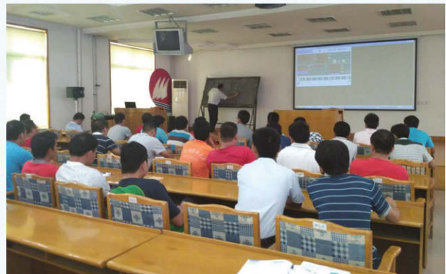
聘請山東勞動職業技術學院專家開展金藍領技師培訓