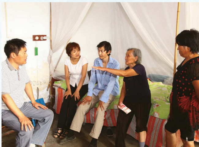
領導慰問困難老人及員工