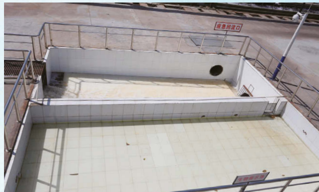
紡織生產園區污水處理廠