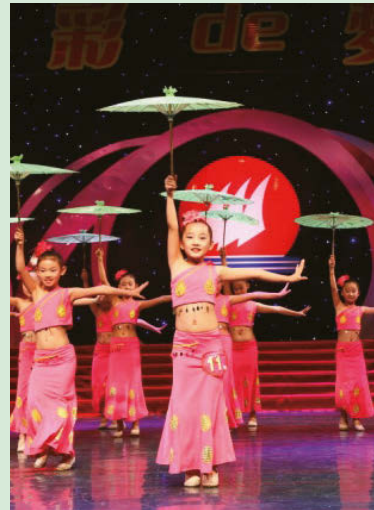
員工子女才藝大賽

其他活動還有：廣場健身文化活動、登山、戶外徒步等健身活動、員工器樂大賽、電影放映周、消暑文藝晚會巡演、曲藝大賽、員工子女才藝大賽、員工「書畫、攝影、DV」作品展、青年歌手大賽、挑戰主持人大賽等。