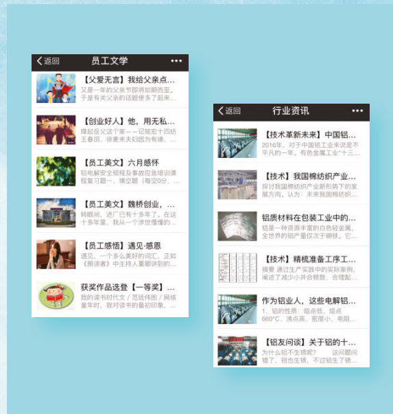
魏橋創業微信公眾號