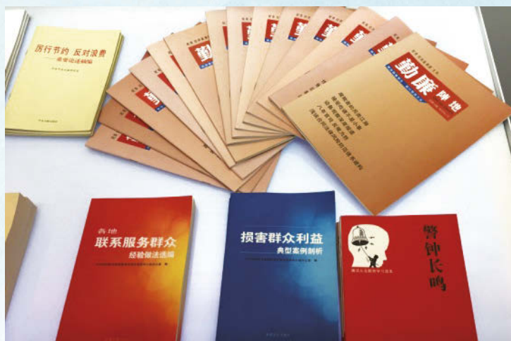
廉潔從業培訓刊物