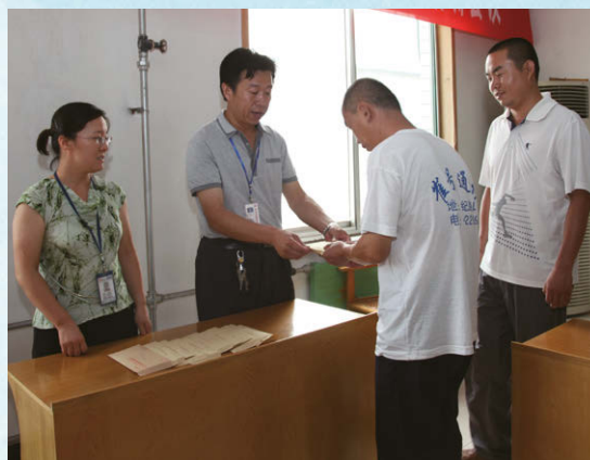
為困難員工發放慰問金

除此之外，本集團亦心繫困難群眾，鼓勵員工組織志願服務活動，通過走入社區和學校，關懷孤寡老人，資助貧困學生，參與無償獻血等方式，奉獻個人愛心，弘揚企業大愛。同時積極響應濱州市政府強化特困家庭社會救助的政策，由母公司魏橋創業主導每年向濱州市慈善總會捐贈人民幣50萬元專項資金用於全市特困家庭救助。