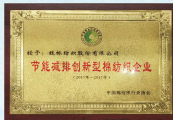
節能減排创新型棉紡織企業證書