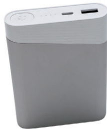
可攜式充電器外殼

於往績記錄期間，本集團按照客戶的規格製造逾15種型號的其他配件，主要包括路由器及可攜式充電器外殼。截至2016年12月31日止三個年度各年及截至2017年8月31日止八個月，本集團分別售出約0.4百萬件、2.0百萬件、3.3百萬件及0.7百萬件其他配件。