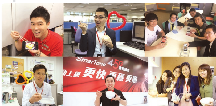
員工參與饑饉一餐，身體力行支持 饑饉30 。