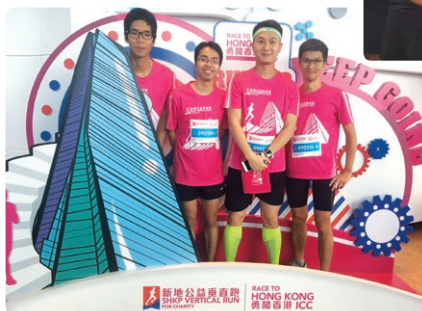
新地公益垂直跑— 勇闖香港ICC