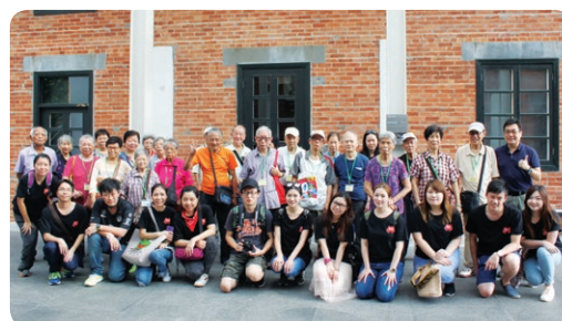
陪伴長者 同遊文化館 。