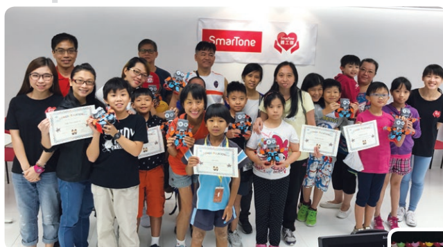
舉辦 SmarTone Robotics 智能機械人工作坊 及成立 才藝獎學金 ，發掘基層兒童的潛質。