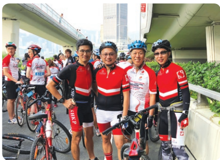
新鴻基地產香港單車節