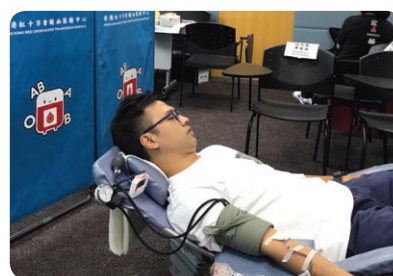
員工踴躍支持 捐血日 。