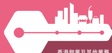
香港物業及其他業務