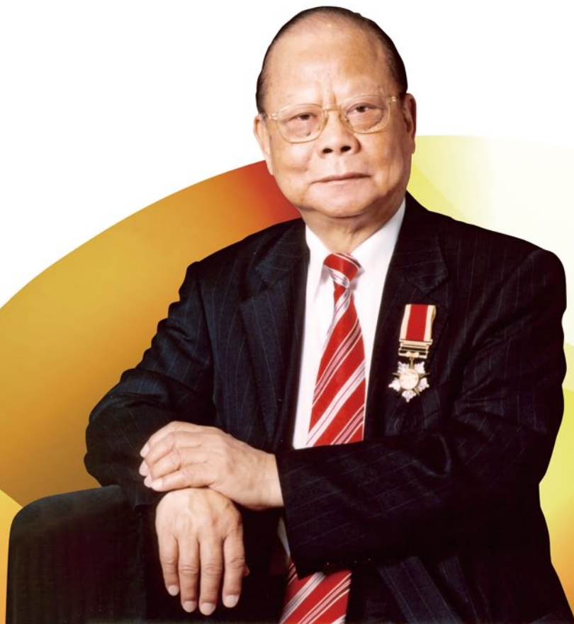
曾憲梓博士 大紫荊勳賢 集團主席