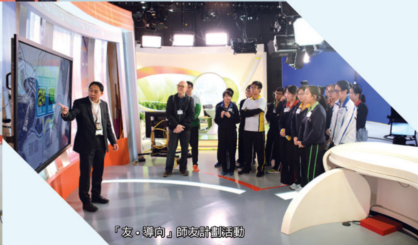
「友·導向」師友計劃活動