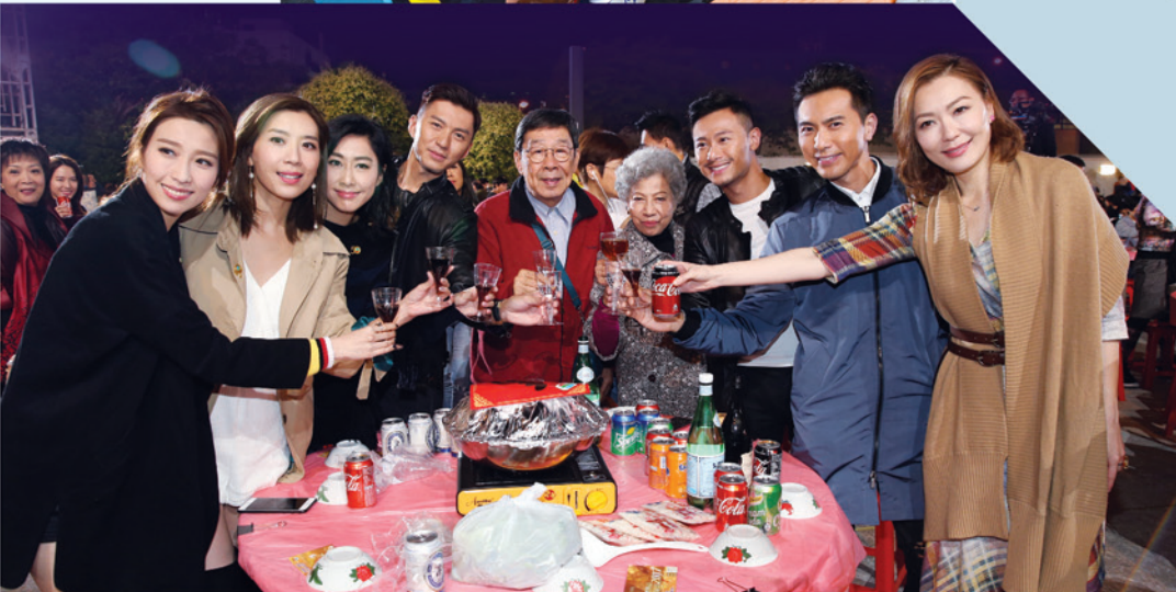
無綫盃中龍混合邀請賽