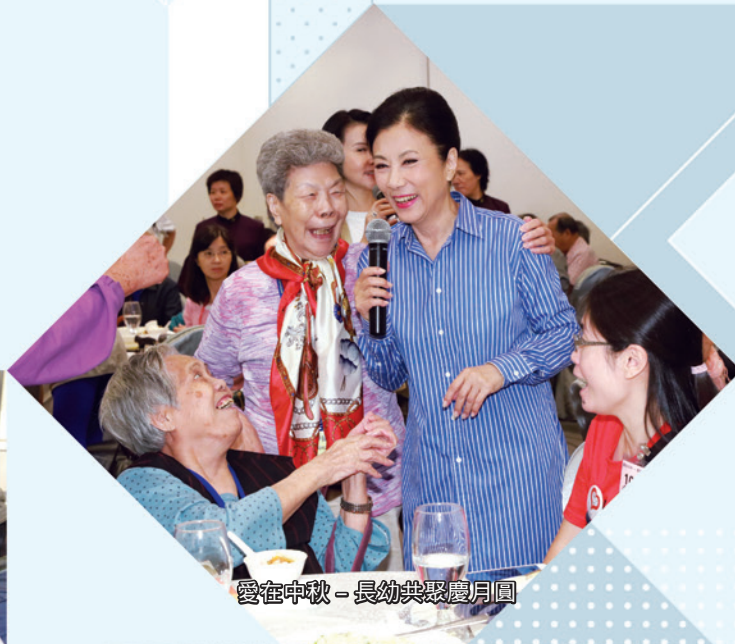
愛在中秋 - 長幼共聚慶月圓