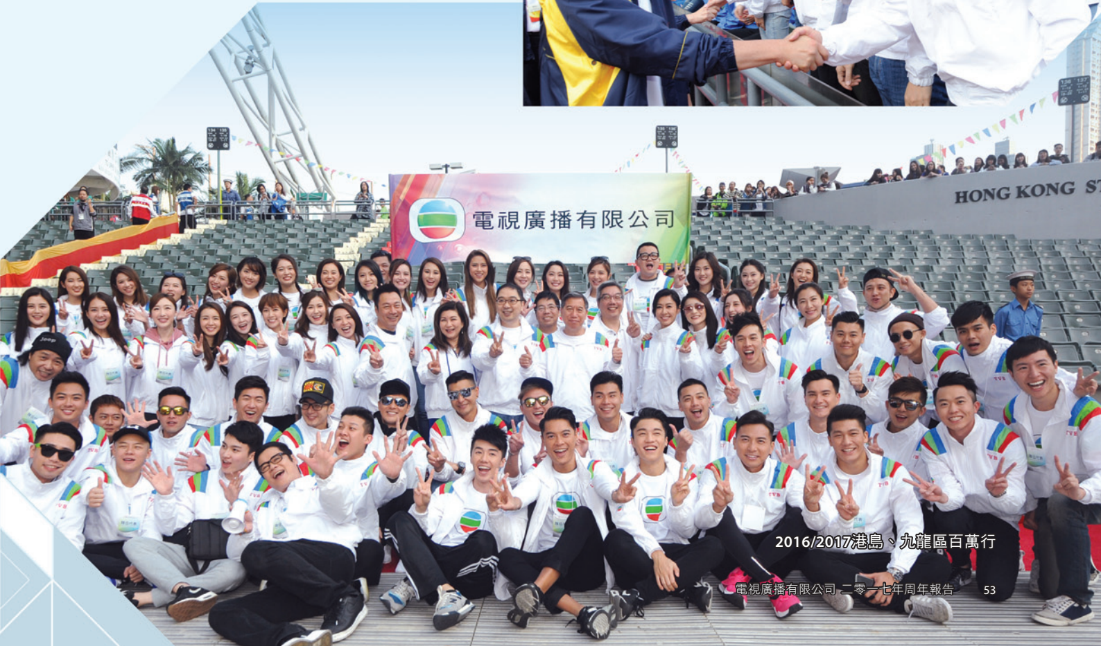
2016/2017港島、九龍區百萬行