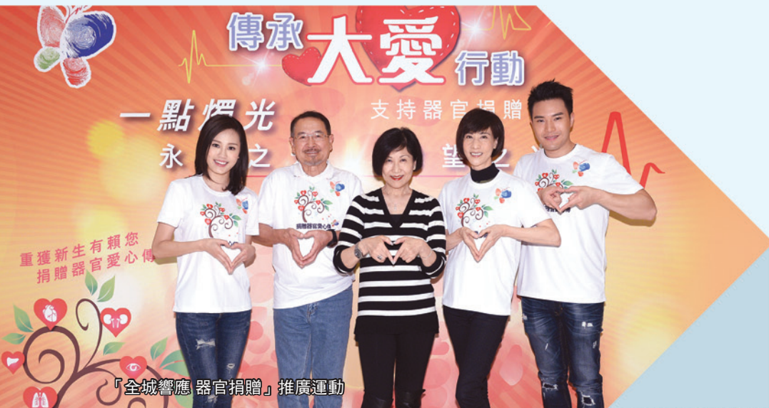
「全城響應 器官捐贈」推廣運動