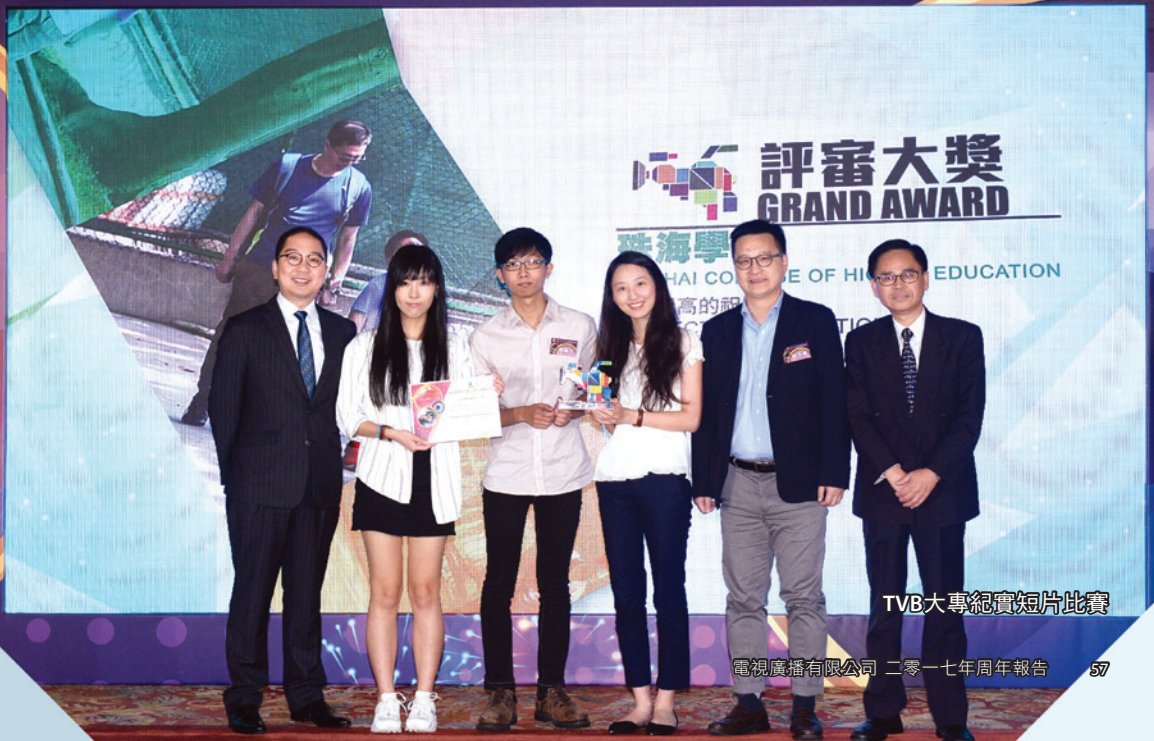
TVB大專紀實短片比賽