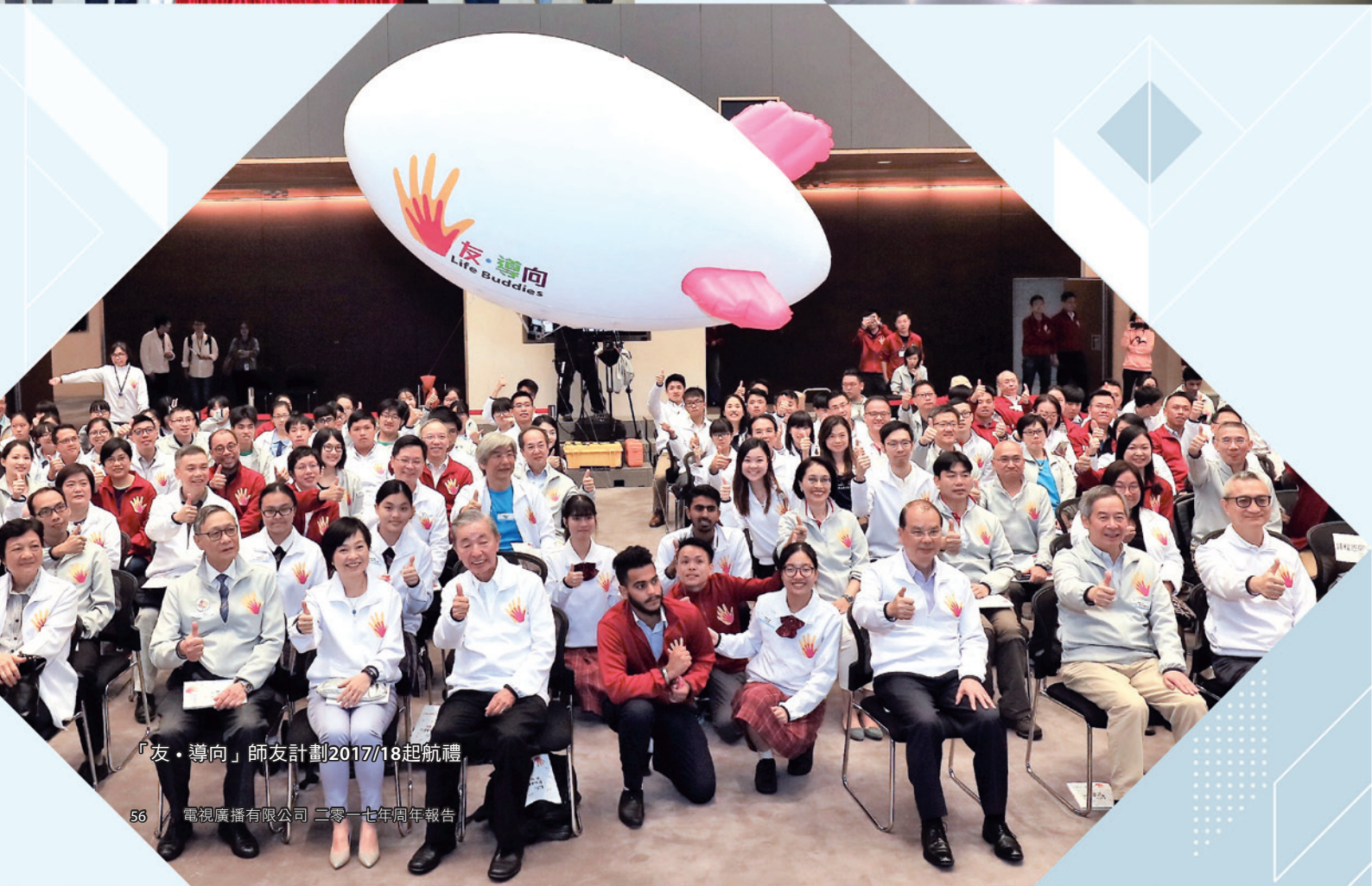
「友·導向」師友計劃2017/18起航禮