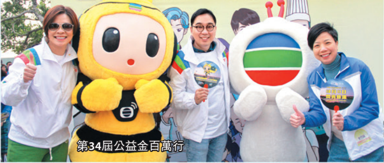
第34屆公益金百萬行