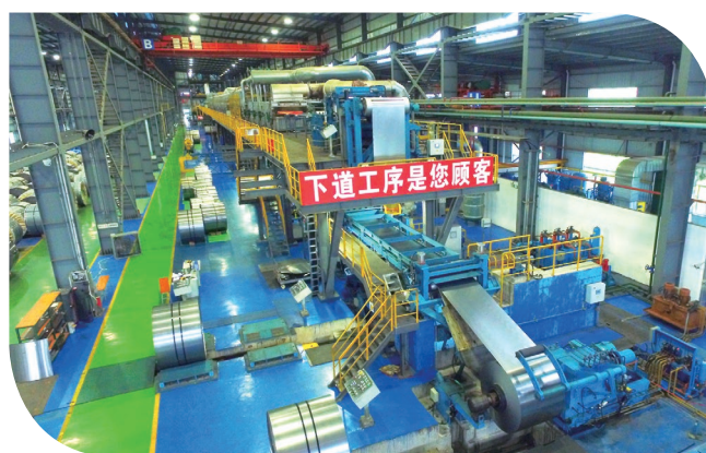
● 鍍鋅鋼材產品生產線

鑑於業內競爭加劇部份由於鋼材價格波動呈上升趨勢，本集團截至2017年12月31日止年度將其冷軋鋼材產品及鍍鋅鋼材產品的加工費(即售價及直