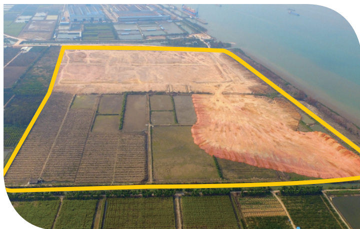
● 古井鎮土地使用權地塊靠近潭江

現有生產廠房的道路距離大約為25公里且均靠近重要高速公路。在正常交通狀況下，古井鎮土地使用權與本集團現有生產廠房的車程需時大約40分鐘。本集團現有生產廠房亦靠近沿西江港口，古井鎮土地使用權靠近銀洲湖岸邊及銀洲湖沿岸港口，銀洲湖位處中國珠江三角洲西南部的西江和潭江的匯合處。古井鎮土地使用權的位置可以使本集團的原材料及產品能透過高效率的高速公路及港口設施及時且具有成本效益地運送，無論其是在中國廣東省及其他省份。江門市地方政府支援發展及興建大廣海灣經濟區，並提升至國家策略層面，與本集團為日後業務進一步發展，因而擴充古井鎮土地使用權的生產設施以提升產能的業務策略一致。