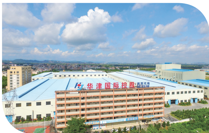
● 本集團位於睦洲鎮的現有生產廠房

於2017年1月4日，本集團在公開拍賣中成功收購位於中國廣東省江門市新會經濟開發區臨港工業區地盤面積約47,486平方米的工業用地的土地使用權，總代價為約人民幣21.4百萬元。競投價已於2017年上半年由本集團悉數支付，而有關工業用地地塊將指定作金屬產品行業的特定用途。