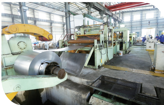
● 冷軋鋼卷板生產線

消耗品包括我們生產過程中所耗用的機械零件及物資。截至2017年12月31日止年度，消耗品亦增加至約人民幣105.5百萬元，較截至2016年12月31日止年度約人民幣51.4百萬元增加約人民幣54.1百萬元或105.3%。該增幅乃主要由於鍍鋅鋼材產品生產增加所致。