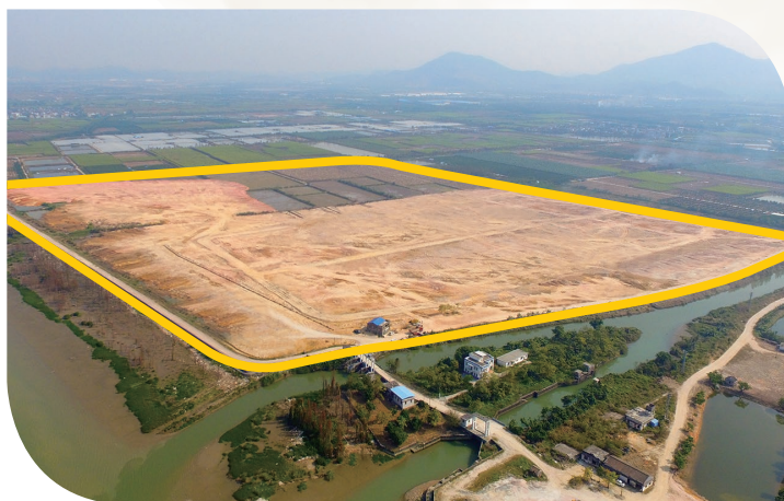
● 古井鎮土地使用權地塊靠近潭江

於2017年12月25日，本集團在公開競投中成功收購位於中國廣東省江門市新會區古井鎮洲朗村，總地盤面積約為284,860平方米的古井鎮土地使用權，總代價約人民幣109.6百萬元。董事會認為，古井鎮土地使用權可提供大片面積，足以應付本集團生產線靈活多變的規劃，在推廣生產效率及長遠發展時可減省日後生產及營運成本。近年，江門市地方政府積極推廣發展及興建大廣海灣經濟區。古井鎮是大廣海灣經濟區內其中一個得到地方政府支持的主要城鎮。在從屬於新會區同一行政區內，古井鎮土地使用權鄰近本集團位於睦洲鎮的現有生產廠房，古井鎮土地使用權與本集團