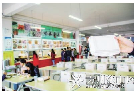
贵州工商职业学院鼓励学生食堂就餐，禁止使用一次性餐具。

本集團提倡廢棄物循環利用的環保理念。紙張和文具皆是教師和學生的常用資源，在使用後需要妥善處理以避免造成資源浪費。因此，雲南學校和貴州學校在校園內一共設置了多個廢紙回收站和廢棄文具回收站，以便教師和學生能有效地協助廢棄紙張和文具的回收利用。此外，校園範圍內的打印機墨盒在墨水用完之後，亦會將墨盒進行回收。回收後的廢紙，廢棄文具和墨盒將交由符合資格的回收公司進行處理。