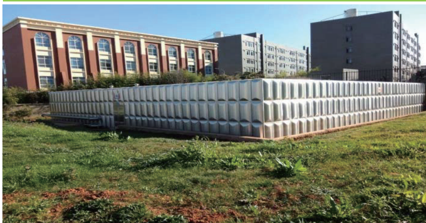
雲南學校的一千立方米自來水儲水池

而為應對學校飲用水源出現短缺或突發意外如水管破裂而導致校園水資源不足的緊急情況，雲南學校和貴州學校均在校園內興建了儲水池。其中，雲南學校興建了一個蓄水量達一千立方米的地下儲水池，以保證教職員和學生用水需求。