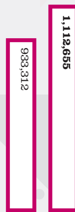
資產淨值 人民幣千元