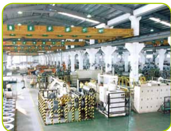
國內廣東省東莞之卷鋼加工中心