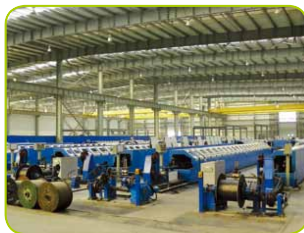
國內天津之電梯鋼絲繩生產線