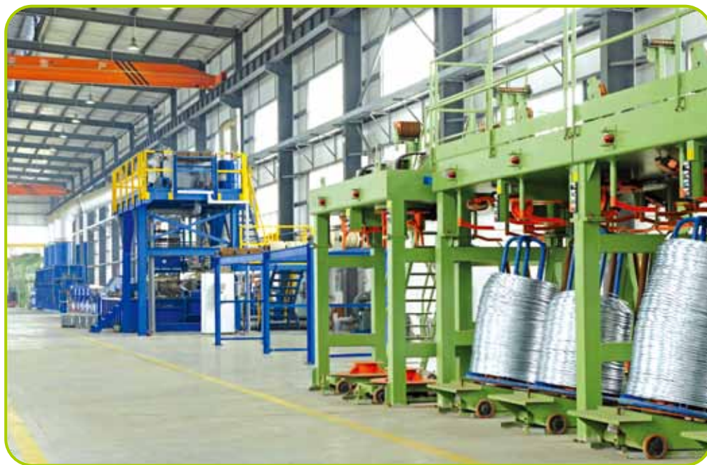
國內廣東省鶴山之鍍鋅鋼絲生產線