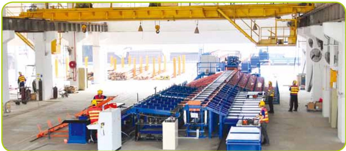
香港大埔之鋼筋增值加工中心