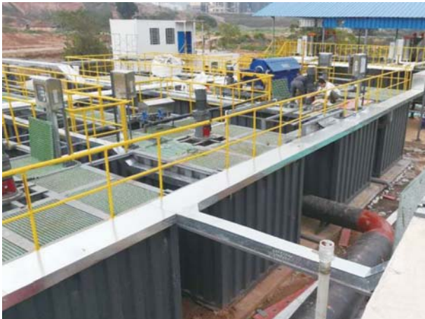
光大南寧水塘江項目