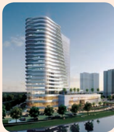
越秀廣州南沙喜來登酒店

越秀廣州南沙喜來登酒店組建了安全委員會，酒店安保部也會組織每月的安全檢查及危機演練，每年會組織至少兩次酒店全員消防疏散演練；新員工加入酒店時會參加有關消防的各類培訓，實踐與理論並用；酒店建立了晚上的應急預案體系和機制，對所有部門進行了針對性培訓，並將應急預案存放於各部門方便所有員工回顧閱讀，員工手冊也包含到安全方面知識，確保所有員工都有健康安全的意識。