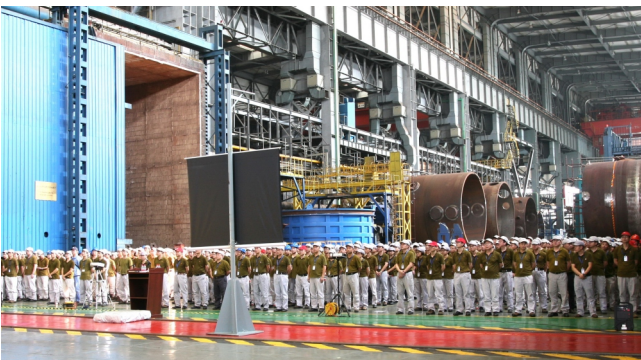
東方重機核安全文化警示教育現場

東方電氣圍繞“質量立企、問題導向、健全體系、強化問責”的質量工作方針，以提升體系運行有效性為目標開展質量工作。