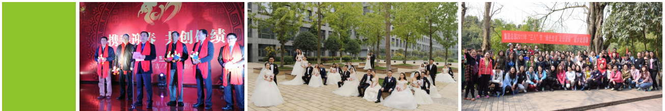
東方電氣2017年新春團拜會

在東方電氣，“人和”文化、“創新”文化、“東汽精神”、“大三綫精神”……在企業發展過程中逐步凝練并升華為深厚的文化底蘊，為企業更好更快發展提供了強大的助推力。“社會、企業、員工和諧統一”的核心價值觀，更是企業以促進社會發展和維護員工利益為己任的重要體現。這些獨具特色的“東方文化”，將伴隨東方電氣一起，向着更加美好的未來邁進。