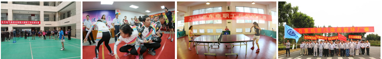
東方電氣總部第六屆職工羽毛球比賽