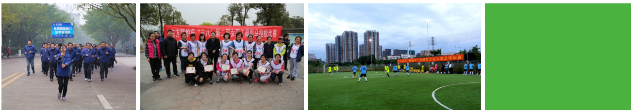
東方鍋爐2017年新年健身跑活動