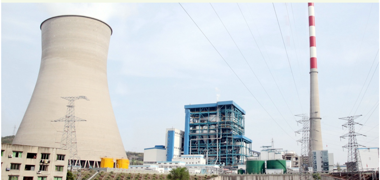
東方電氣研制的世界首臺600兆瓦超臨界循環流化床鍋爐在四川白馬電廠投運

提高蒸汽參數是火電技術領域節能減排的關鍵技術，東方電氣積極開展清潔高效1000兆瓦等級630°C二次再熱機組開發工作，研制方案已通過國家級評審，該項技術應用工程已被列為國家電力創新示範項目。清潔高效1000兆瓦等級630°C二次再熱超超臨界鍋爐出口主蒸汽壓力36.75MPa.a、主蒸汽溫度620°C、再熱蒸汽溫度633°C，將機組蒸汽參數提升至新的高度，促使煤電機組發電效率取得質的飛躍。為將煤電機組發電效率從目前最為先進的48.12%提升至50.01%奠定堅實基礎，每度電節約10克標準煤，單臺百萬機組每年節約標準煤50000噸。項目研制成功后將實現中國超超臨界技術跨越式發展，標志着我國重大裝備技術已躋身世界領先行列，對推動煤炭清潔高效利用和行業技術的進步具有重要意義。