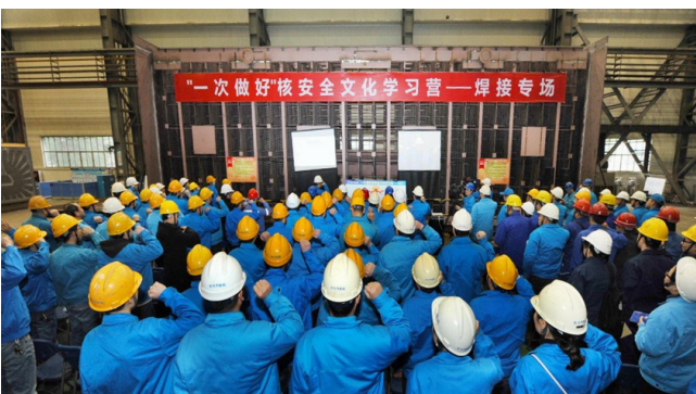
東方汽輪機 “一次做好 核安全文化學習營”