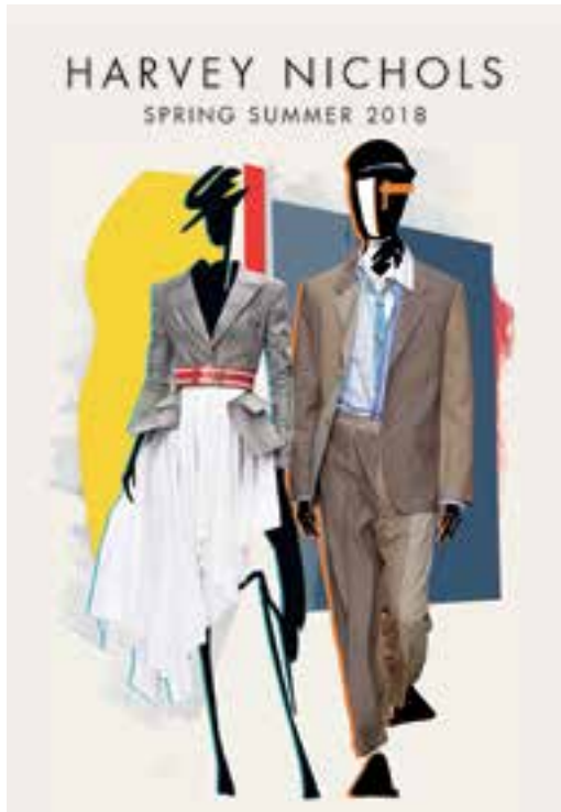
Spring / Summer 2018 fashion at Harvey Nichols. 於「Harvey Nichols」的二零一八年春/夏季時裝。