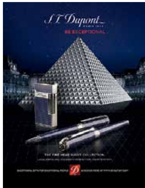
S.T. Dupont 'THE FIRE HEAD NIGHT COLLECTION' lighter and writing instruments. 「都彭」的「THE FIRE HEAD NIGHT COLLECTION」 打火機及書寫文具。