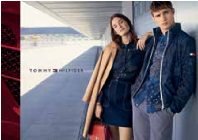
Fashionwear by Tommy Hilfiger. 「Tommy Hilfiger」時裝。