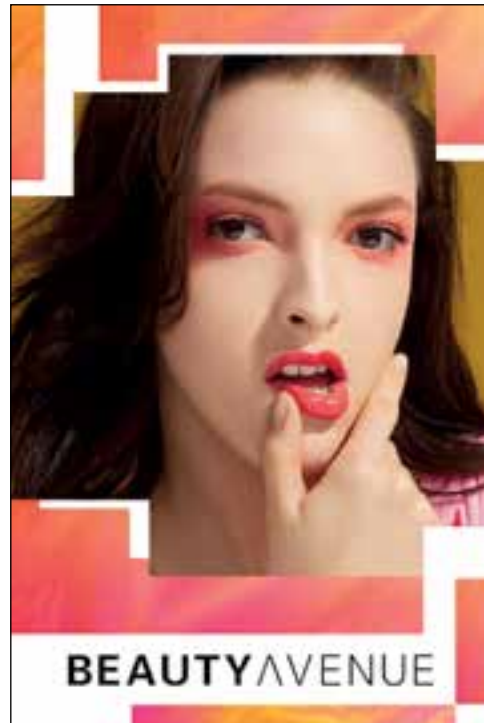
Cosmetics and beauty products at Beauty Avenue. 於「Beauty Avenue」的化妝及美容產品。

我們相信，沒有直接品牌擁有權之多品牌時裝營運商，將面臨來自國際性（尤其是來自歐洲）之網上營運商前所未有之毛利率壓力。零售商必須成功改變其零售模式，不然將面臨被淘汰之可能。