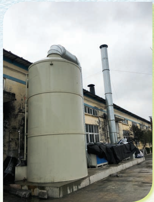
有機化學物處理設備

本集團貫徹遵守《中華人民共和國水污染防治法》及國務院關於《水污染防治行動計劃的通知》，我們對有毒有害的廢水進行單獨處理，處理後統一排放到綜合污水處理廠作進一步處理，綜合污水達標後，排入工業區污水處理廠再行處理，而最後經蘇北管網排放入海。脫毛工序產生含硫等有毒的廢水經物理化學程序處理後，把毛、渣過濾出來，將液體和固體分離，再將脫硫後的液體和其它廢水排放至綜合污水處理廠。國家的各個環保部門皆能透過互聯網上的自動監控儀，隨時監察廠房的氨氮排放和化學需氧量的數據，此兩項濃度一直是達標的。經處理的廢水，我們會用回收水清洗地面，以減少水資源的使用。