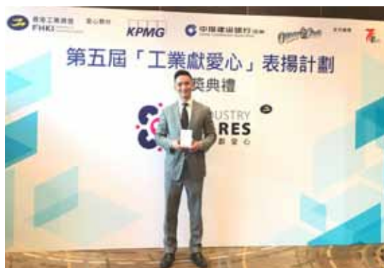
「第五屆工業獻愛心，愛心關懷證書」