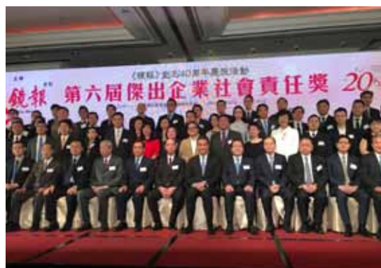
「傑出上市公司巡禮2017」