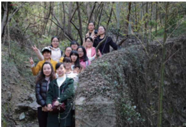
於婦女節當日進行郊遊活動

我們重視我們與僱員的關係，推廣健康、工作生活平衡的環境，並為所有員工創造正面和諧的工作場所。為加強僱員的歸屬感，於本報告期內，我們已舉辦一系列活動，例如週年晚宴、元宵節慶祝、婦女節郊遊及父親節活動。