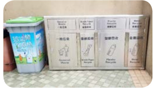
由本集團管理，位於香港赤柱之豪華住宅發展項目「富豪海灣」，已放置三色廢物分類回收桶及玻璃樽回收桶。