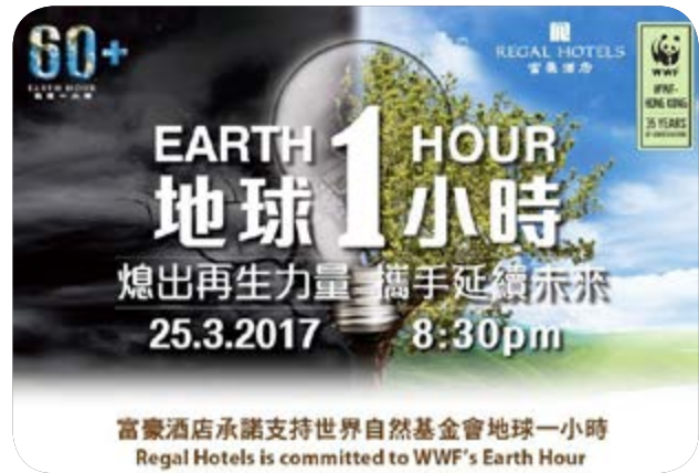
富豪參與世界自然基金會「地球一小時」活動。