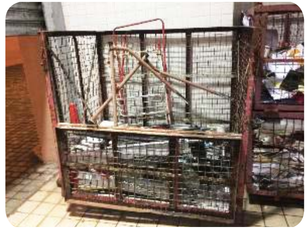
富豪海灣已設立廢紙、紙板及廢鐵回收站，以作循環再用。