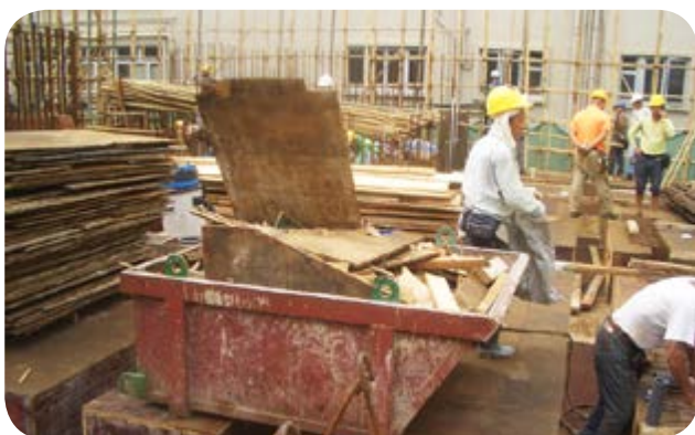
於建築地盤回收木材再用

我們致力提高物料重用及循環再用比率。廢棄物料須首先進行分類。我們會在指定廢棄物存放區設置附有明確標籤的回收箱。設備及物料包裝會回收並存放於乾燥的有蓋空間，以防止循環再用物料交叉污染。建築地盤的多類廢料可進一步重用及循環再用。例如，我們使用經森林管理委員會及美國森林及紙業協會認證的可持續木材或「已知持牌來源」木材。一般樓層建築使用鋁材模板，以減少使用木材，狀態良好的木材將盡量多次重用。除木材外，支架與臨時棚架物料會予回收，並送往本地再造廠。我們藉此得以降低採購建築物料成本，並可減輕堆填區之壓力。