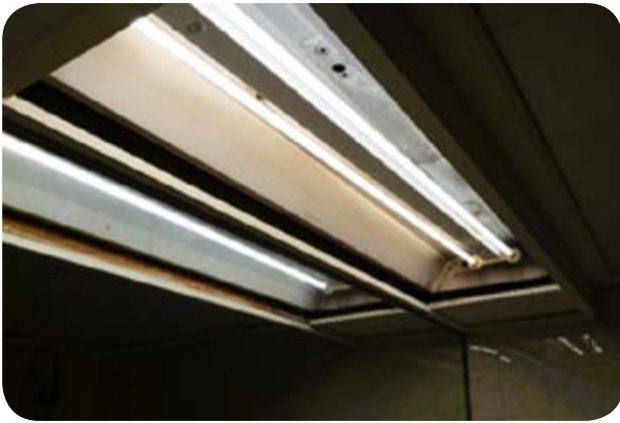
為進一步節約能源，富豪已經或正在以LED光管取代客房及公眾地方的T8螢光燈管。

富豪亦已採取多項具體措施以減少溫室氣體排放量。例如大部分酒店已設立電動車充電站以推廣低碳交通工具，而旗下酒店如富豪環球東亞酒店等原有的柴油裝置已被較低碳的天然氣裝置取代。結合其他抵銷碳排放的措施，富豪灣仔酒店得以成為全港首間碳中和酒店。