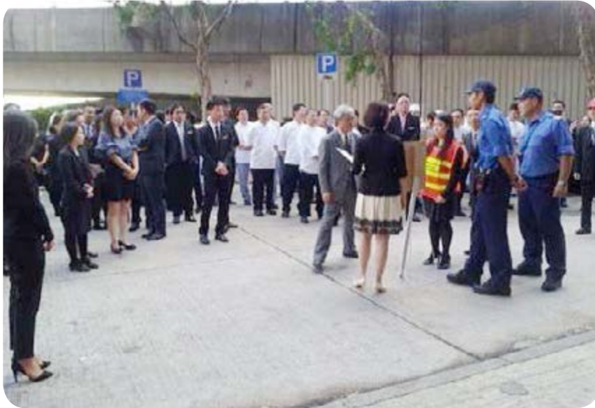
富豪定期舉行火警演習以提高員工的安全意識。

持續建立安全意識對維持健康及安全的工作環境攸關重要。就此，富豪已張貼海報並向員工派發健康與安全資訊單張、通訊簡報及告示，並於酒店辦公室、工作間及員工福利設施當眼位置貼出相關警告標誌、應變及救援程序、通告及標語牌以提醒員工。富豪亦根據安全獎勵計劃定期頒發安全獎項，以表揚個別人員的良好健康及安全相關表現。