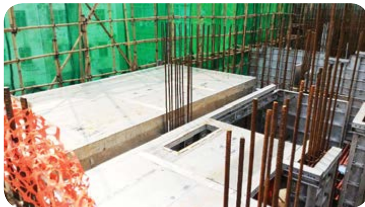
一般樓層建築使用鋁材模板，以減少使用木材。