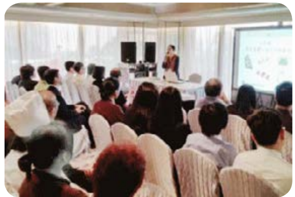
新入職人員任職培訓