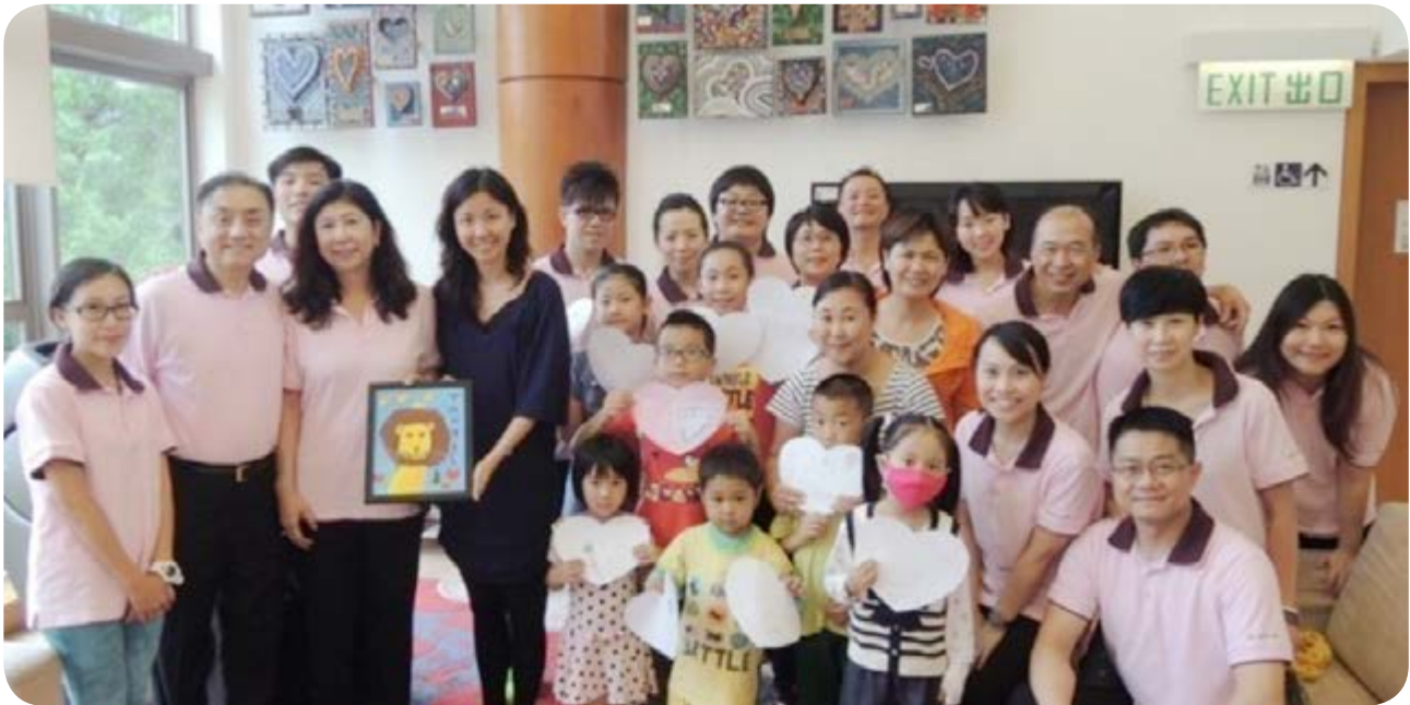
富豪的義工隊伍探訪麥當勞叔叔之家。

富豪重視健康發展，並致力宣揚健康生活方式及為有需要人士提供資源。於本年度，富豪舉辦的項目包括旨在為年輕人提供安全環境以享受香港國際七人欖球賽的活動「Save Our Sevens」、為沙田麥當勞叔叔之家進行義務清潔及為兒童癌病基金舉行義賣。