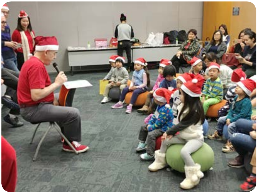
孩子們正細心聆聽富豪員工述說有趣的故事。

富豪竭力成為經營業務所在社區的領先企業公民，視社區為實踐對社會負責的基本要素、對社會負責為富豪長期持續發展的支柱之一。為了實踐我們的社區承諾，富豪定期舉辦志願活動，攜手服務及造福社區之餘，亦能養成年輕一代貢獻社會的責任感。於二零一七年，富豪推行各式各樣的社區服務計劃，並集中贊助屬於青少年發展、提升健康和社會共融此三大範疇內的多個非牟利機構。其所作努力已獲得社會認同。