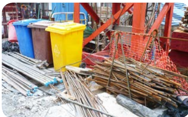
現場廢棄物分類區