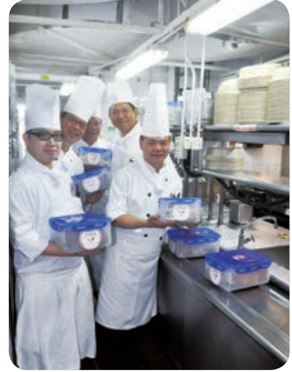
富豪旗下部分酒店與膳心連基金合作，捐贈未食用的食品以減少浪費食物。

有關富豪及四海於報告期間內的環境表現及措施的進一步詳情，請參閱其各自之二零一七年ESG報告中有關環境的章節。