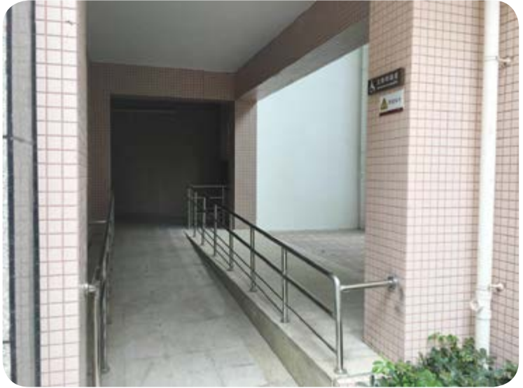
住宅大樓為協助殘障人士出入而設計的斜坡

於項目設計和規劃過程中，四海視社會共融為項目元素之一。以成都項目為例，四海在設計第一及第二期住宅大樓時考慮到殘障人士的需求，為其設置斜坡以方便出入大樓。我們希望透過此等包容性設計，弱勢及殘障人士亦能享用無障礙通道。