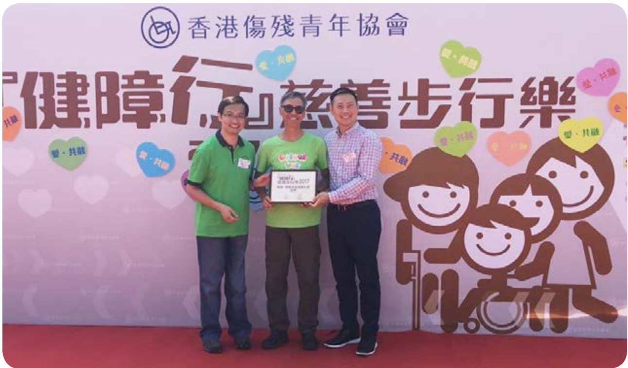
富豪鼎力支持「健障行」慈善步行樂2017。

富豪期望建立相互共融的社會，並珍視每一個人作為獨立個體，而不論他們的背景和能力。每個人均應享有平等且受到尊重。故此，富豪致力通過社會活動去接觸社區內的弱勢群體及了解他們的需要，以助其策劃日後的社區服務。富豪支持多個社會共融活動，例如由香港傷殘青年協會舉辦的大型籌款活動「健障行」慈善步行樂2017。富豪亦與香港傷殘青年協會攜手合作，於年度內為傷殘青年舉行共7次一日遊。