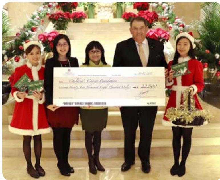
於二零一七年，與兒童癌病基金一同舉辦的慈善曲奇義賣圓滿成功。

富豪重視健康發展，並致力宣揚健康生活方式及為有需要人士提供資源。於本年度，富豪舉辦的項目包括旨在為年輕人提供安全環境以享受香港國際七人欖球賽的活動「Save Our Sevens」、為沙田麥當勞叔叔之家進行義務清潔及為兒童癌病基金舉行義賣。