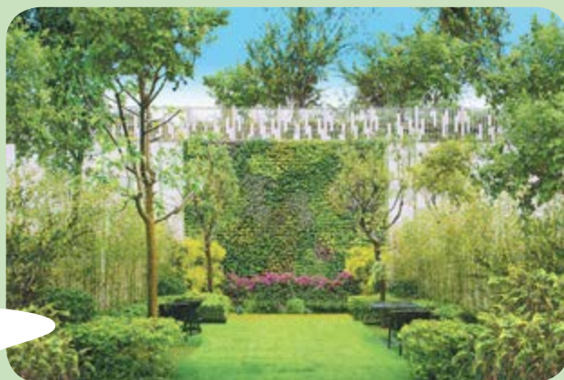
富豪 • 悦庭內的「綠化牆」

我們致力減少對環境的影響及提高我們發展項目的環境質素。於富豪 • 悦庭，我們透過將綠化率維持於35%而減少我們對環境的影響。高綠化率可為住客創造更美好的居住環境，有助碳同化作用進行及促進物業發展項目的生物多樣性。