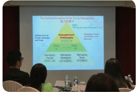
員工培訓及發展研討會