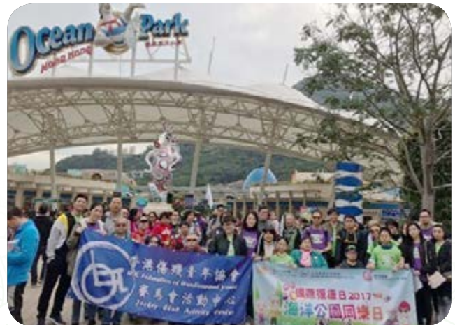
富豪為傷殘人士舉辦一日遊以推動社會共融。