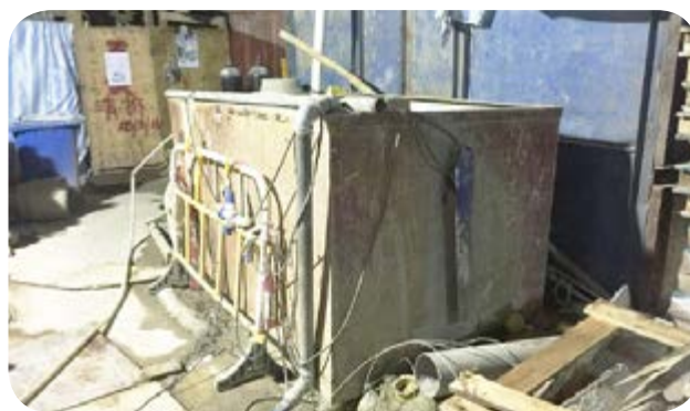
建築地盤的污水處理設施