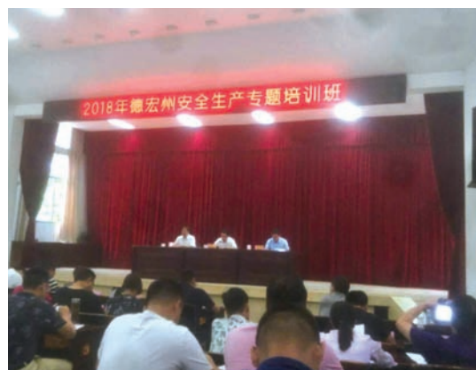
公司員工參加政府組織的安全培訓。

隨著我們不斷發展，為確保團隊質素不斷提升，本公司將逐步增加員工接受培訓的機會，並不斷檢視和改進培訓課程，使其配合業務營運和員工的需要。