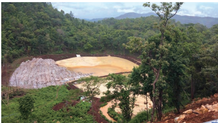
昂久甲礦場新興建的尾礦庫，當中採用了充足的防滲措施，有效防止了尾礦的滲漏。

於本期間，我們持續嚴格遵守所有現行香港、中國以及緬甸的有關安全生產及勞工標準的法律法規。根據我們的資料及所知，本集團於本期間內並沒有任何重大違反任何現行的安全生產及勞工標準法律法規。