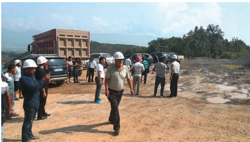
我們定期與安全監察及環保部門對我們的礦山及選礦廠進行安全檢查。