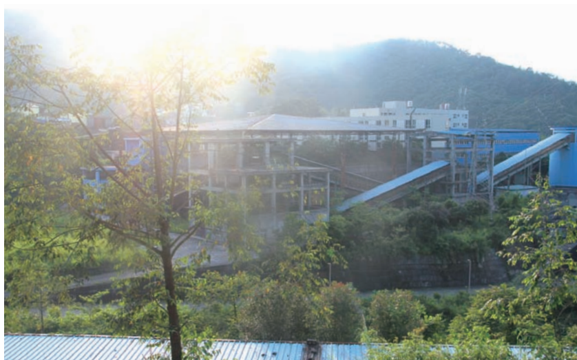
我們的獅子山礦場的選礦廠的建設及營運符合環境保護相關規定及要求。

我們一直遵守各項中國及緬甸環保法律法規，並持續採取一切必要的環境保護措施，認真落實礦山環境恢復治理保證金制度，嚴格執行環境保護「三同時」制度，編製和落實礦山環境保護與治理恢復方案，礦山生產期間未發生重大地質災害。