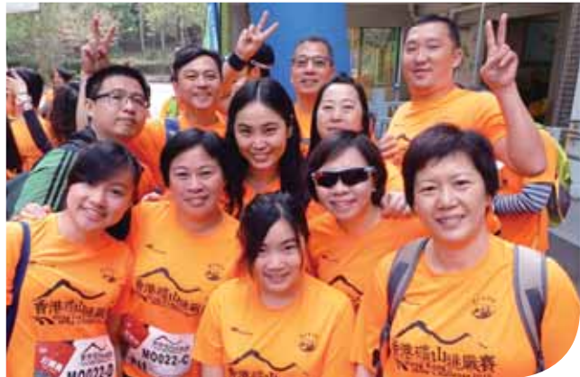
員工與親朋一同參加基督教香港信義會社會服務部舉辦的「礦山挑戰賽2018」