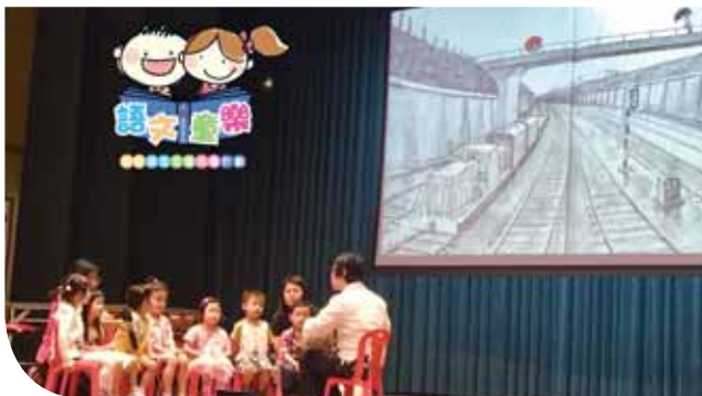
「銀娛讀寫支援先導計劃」家長講座中現場示範講故事的技巧

「銀娛社區護理計劃」迄今已向十名護理系學生頒發了獎學金，作為此計劃的其中一個主要部分，二零一七／一八年度的獎學金受益學生已前往澳洲進行學習交流。於二零一八年六月畢業的五名學員將會投身社區護理工作，以履行參與獎學金的義務。另外，「銀娛社區護理持續教育課程」第二批以公共衛生為主題的課程亦已展開，供澳門在職社區護士修讀，並會在未來18個月持續授課。「銀娛社區護理計劃」的研究部分專注於兩大主題：澳門社會的精神健康素養以及澳門社區評估研究；以上主題的研究結果預計會於二零一八年下半年發表。