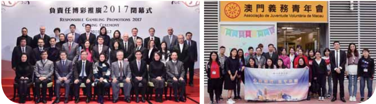
銀娛持續為員工舉辦內部推廣活動及與本地非政府組織合作，以支持負責任博彩