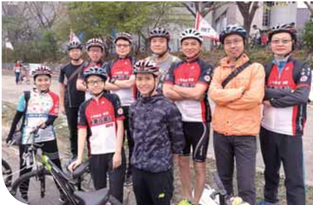
「上海商業博愛單車百萬行2018」

嘉華建材在內地的南京南鋼礦渣廠安裝全新的環保防塵裝置，旨在減少水渣原料倉庫場裏粉塵的排放。