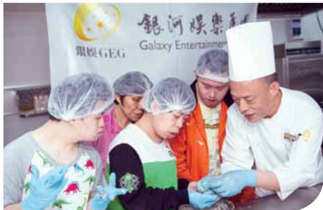
銀娛在「澳門百老匯™」舉行「地道文化美食節」期間，安排「澳門百老匯™」得獎廚師為澳門扶康會學員主持烹飪工作坊