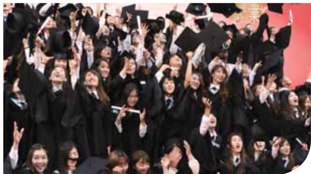
「銀娛社區護理計劃」2018年畢業典禮