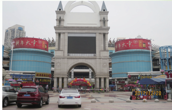
正露丸戶外大牌廣告