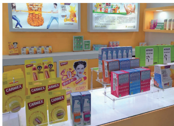
Carmex於中國美容博覽會展位上的產品展示