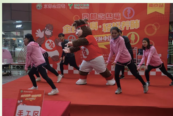
第四屆念慈菴全民健身輕鬆養肺嘉年華活動

二零一八年下半年，本集團將持續強化和區域連鎖的加強合作，借助念慈菴的品牌力和影響力，把念慈菴枇杷膏的鋪貨範圍進一步拓展至更多的縣級和鄉鎮市場，吸引更多的消費者體驗念慈菴枇杷膏，繼而提升銷售。