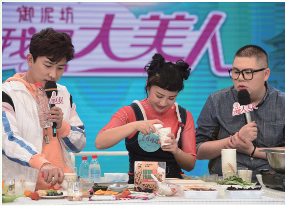
湖南衛視《我是大美人》節目中，減肥達人介紹Tilman植物瘦身茶配合飲食的使用方法

本報告期內，本集團「全球瘦」產品系列針對年青及愛美的消費群體，分別在線上及線下渠道制定多元及互動的宣傳推廣。期內，我們於湖南衛視《我是大美人》節目中，透過減肥達人親身體驗比利時的Tilman植物瘦身茶，成功吸引不少愛美的消費群試用；而來自意大利的ZUCCARI濃縮瘦身100%菠蘿汁在香港市場經已於「莎莎」、華潤堂和萬寧等終端零售店成功上架。社交媒體宣傳方面，我們善用小紅書等購物分享類平台達人推薦產品，成功吸引不少粉絲的關注。未來，本集團將持續加強「全球瘦」產品系列在小紅書等購物分享類平台達人推薦，並結合線下展會的活動，提升品牌的知名度及銷售。