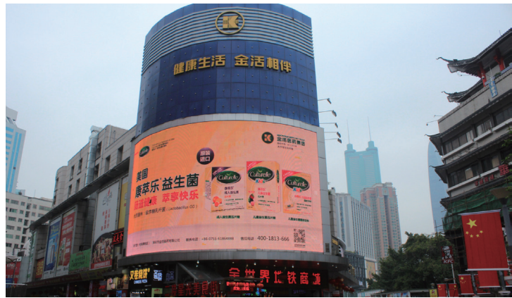
康萃樂在深圳東門的戶外大型廣告牌