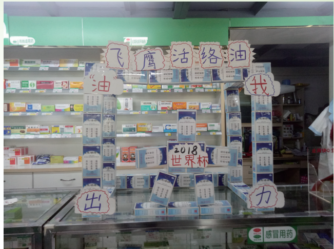
飛鷹活絡油在連鎖藥店的产品陳列