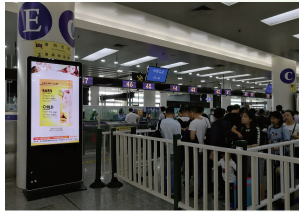
Lifeline Care 魚油在深圳福田口岸的 LED 電子廣告牌