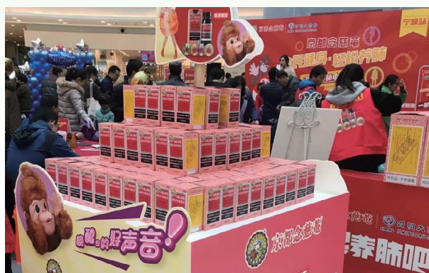
念慈菴養肺嘉年華活動的產品陳列