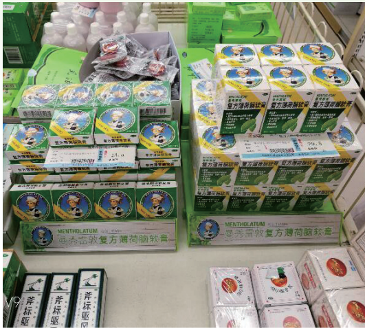
曼秀雷敦系列在連鎖藥店的产品陳列