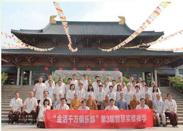
於廣州花都舉行的「第三屆智慧禪學實修」的大合照

本報告期內，本集團聯同「金活關愛健康基金會」先後支持多個公益活動，主要包括捐贈「金活愛心藥包」至中國多個社區，向全國超過50家寺院僧眾捐贈金活依馬打正紅花油及非洲海底椰潤喉糖；在香港捐贈「康萃樂成人益生菌膠囊」至循道衛理中心的多名長者；「金活關愛健康基金會」同時協助中國兒童少年基金會舉辦全國大型公益活動「中國兒童免疫力現狀宣傳科普行」。另一方面，本集團聯同「金活千萬俱樂部」和「金活關愛健康基金會」舉行「第三屆智慧禪學實修」，邀請多位知名大法師為一眾企業家和企業高管進行開示。