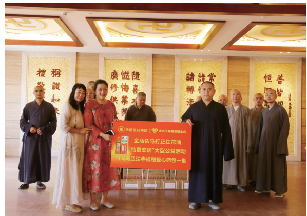
本集團與「金活關愛健康基金會」捐贈金活依馬打正紅花油及非洲海底椰潤喉糖至全國超過50家寺院僧眾