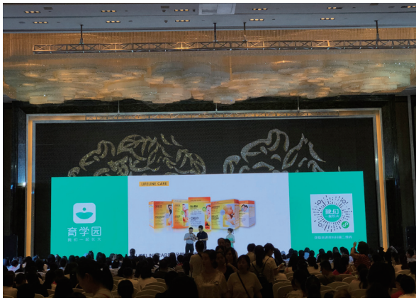
崔玉濤醫生全國巡迴千人演講活動

本集團抓緊國內母嬰市場的二胎紅利，自二零一六年引進挪威的 Lifeline Care 母嬰魚油營養素產品系列。報告期內，本集團分別在線上及線下渠道制定具針對性的市場推廣方案，線上渠道分別與網易考拉、天貓國際、京東、唯品會等進行促銷活動，以及派發產品試用裝，增加消費者的體驗口碑，有效提升品牌曝光率和流量。此外，我們更透過 120 位的母嬰 KOL，把超過 350 篇的軟文植入各大社交平台，觸達千萬粉絲。另一方面，我們聯同崔玉濤兒科醫生於網易考拉直播育兒節目「我的職場媽媽」，成功錄得超過 150 萬人次的觀看記錄，以及舉辦千人巡迴演講活動，並在香港及深圳的八大關口岸投放廣告。