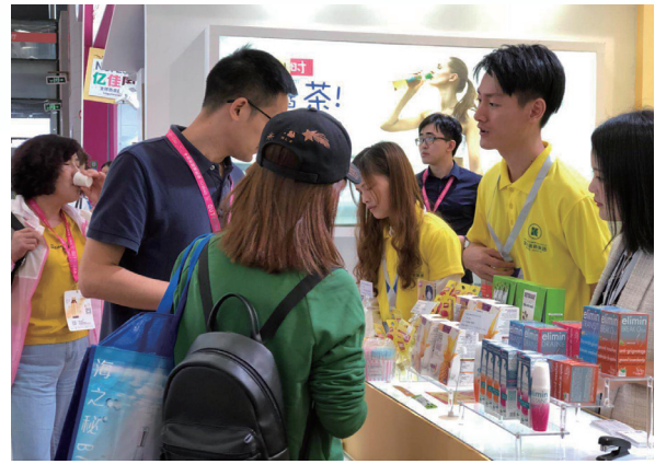
2018年5月於上海美博會內，展示Tilman植物瘦身茶和Zuccari菠蘿汁等產品