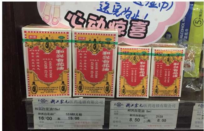
和興白花油在連鎖藥店進行的產品買贈活動