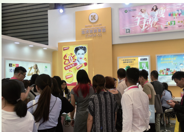
Carmex於2018年5月在上海舉辦的 中國美容博覽會的產品展位

二零一八年第二季度，本集團引進風靡全球逾80年發展歷史的世界頂級護唇膏—美國CARMEX小蜜媧修護唇膏系列，並成為其於大中華區(台灣除外)的獨家總經銷商。CARMEX在美國便有超過1,500萬美國人使用，在歐洲市場如英國、挪威等常年銷量位居前三，全球每分鐘賣出超過145支，累計銷售超過10億支，連續18年蟬聯美國專業醫藥雜誌Pharmacy Times全美藥劑師推薦第一名護唇膏品牌。CARMEX小蜜媧修護唇膏系列將在今年的第三季度於市場重新鋪貨及進行一系列的品牌推廣活動，覆蓋的渠道拓展至國內多個區域城市及大型商超連鎖如屈臣氏，未來還積極拓展至美妝及便利店等。