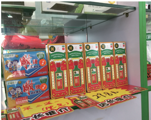
金活依馬打正紅花油在連鎖藥店開展的 消費者買贈活動