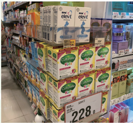
康萃樂在香港萬寧的產品陳列

二零一八年下半年，本集團將聚焦於核心連鎖，如樂友孕嬰童連鎖、山姆、萬寧及屈臣氏等，把活動和門店的動銷相結合，加強品牌在大中華區域的知名度。