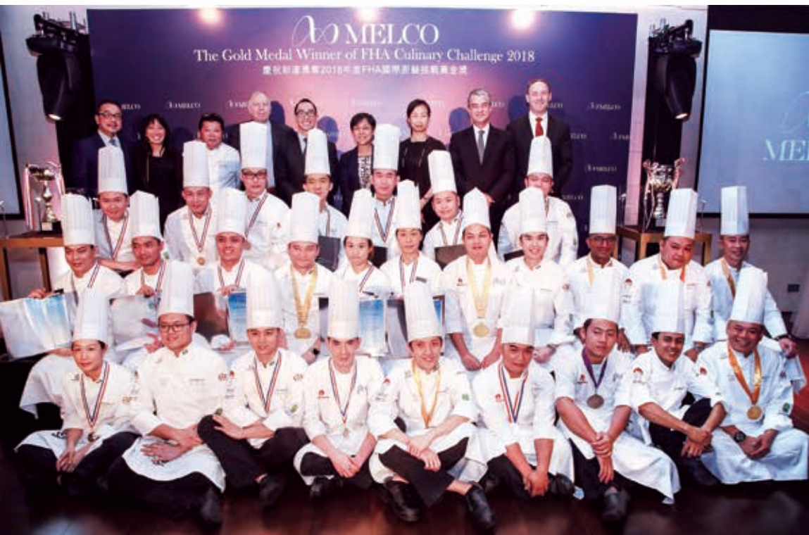
本集團的餐飲團隊勇奪 2018 FHA 國際廚藝挑戰賽金獎，並代表本澳首度出戰2020 IKA奧林匹克世界餐飲競賽，這充分肯定新濠餐飲團隊的廚藝才華及矢志為賓客呈獻極致非凡餐饗體驗的決心。

於截至二零一八年六月三十日止六個月，新濠影滙之淨收益為682,600,000美元，而二零一七年同期則為609,900,000美元。新濠影滙於截至二零一八年六月三十日止六個月錄得經調整物業EBITDA為183,300,000美元，而二零一七年同期之經調整物業EBITDA為148,500,000美元。經調整物業EBITDA按年增加主要由於所有博彩分部之表現均見提升。