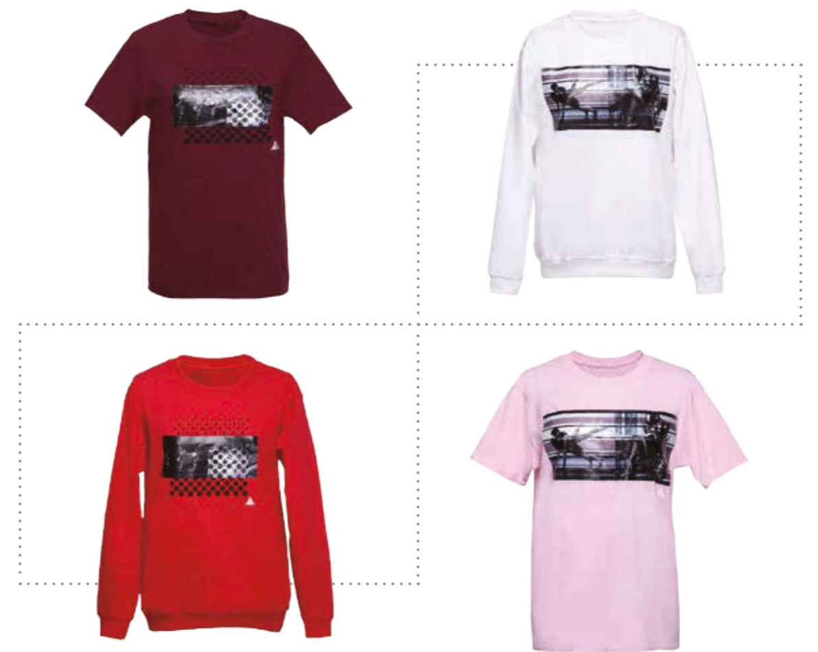
為與演藝學院友誼社的慈善合作推出的T恤

除追求業務發展以外，本集團亦不遺餘力實現慈善目標。於本年度，我們向不同性質的組織捐款，例如家庭發展基金、演藝學院友誼社及香港高等教育科技學院，彰顯我們對家庭發展、藝術及教育等社會各領域的支持。本集團亦注重兒童和婦女的需求，透過捐款支持港區婦聯代表聯誼會及愛基金會等組織的營運，為兒童和婦女提供關愛與支持。我們將繼續加強對有需要人士的支持，為社區做出貢獻，建設健康和諧社會。