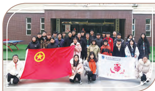
送溫暖活動，西安鐵道學院

2018年是學校連續第六年參加此活動；今年共有120名師生為馬拉松的順利進行保駕護航