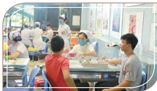
無償獻血志願服務活動，白雲技師學院