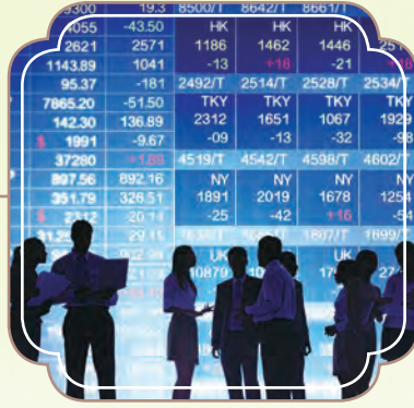
成為恒生綜合指數系列成分股， 包括恒生綜合大中型股指數