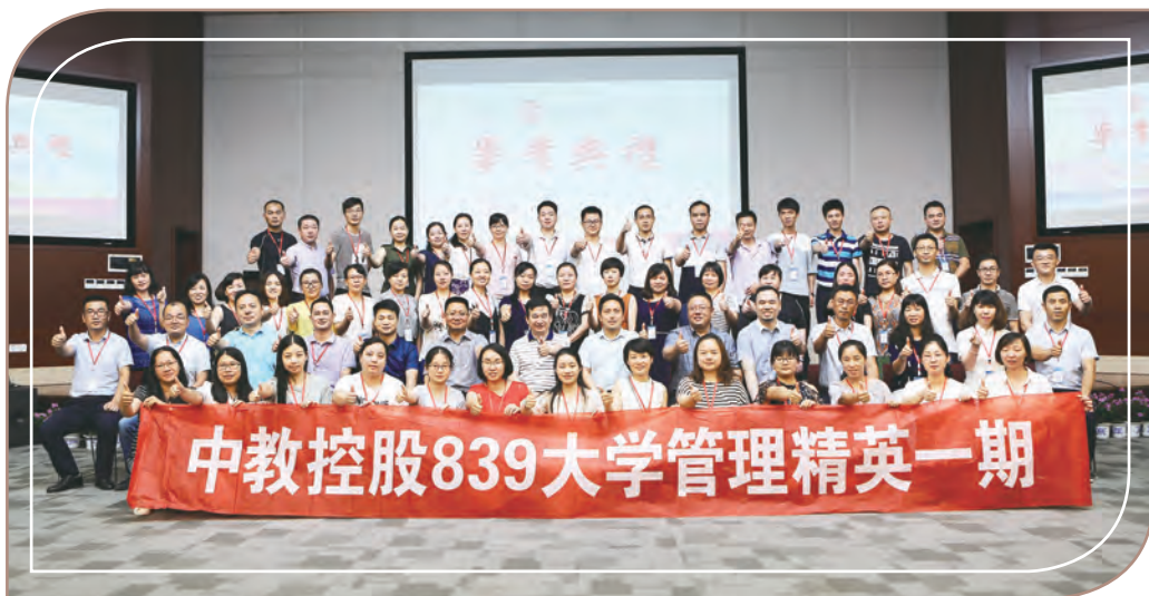
公司為完成839大學培訓的員工舉行畢業典禮，2018年夏天

集團高度重視員工發展和培訓。為保持和增進僱員的教學能力和管理水平，集團以及旗下學校均會結合實際需要制定了全學年的員工培訓計劃。培訓活動聚焦於文化的傳播和業務能力的提升，以經驗的萃取和傳承為目標，主要採用案例分析的培訓模式，全面提升僱員的知識儲備和業務能力。本集團大力鼓勵教職工參與入職前培訓，以及教師及輔導員資格、學術講座、創新創業相關的專業培訓。本集團也鼓勵他們參與論壇、研討會、其他學科的會議及專業培訓，以及海外交流機會。