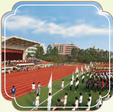
完成收購松田大學及松田學院