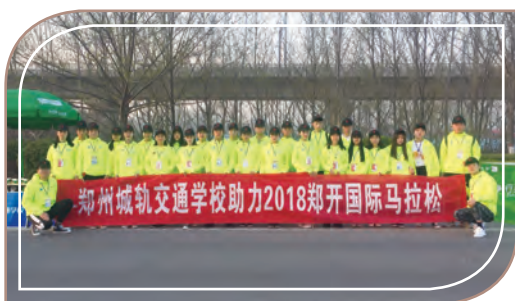
鄭開國際馬拉松志願者活動，鄭州城軌學校

2018年是學校連續第六年參加此活動；今年共有120名師生為馬拉松的順利進行保駕護航