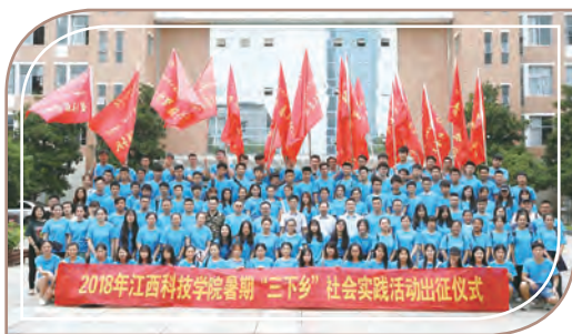
暑期「三下乡」社會實踐活動，江西科技學院

在報告期內，集團旗下五所學校遵紀守法和誠信經營的同時，均在各自社區積極踐行企業社會責任，為社區公益事業發展做了巨大貢獻。以下是部分社會公益活動的精彩回顧：