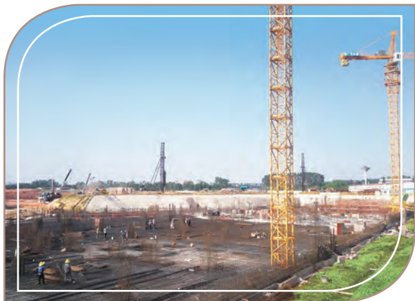
廣東白雲學院新校區建設中

於2018年6月29日，本集團與惠理深圳(惠理集團有限公司的子公司)就成立目標資產管理規模為人民幣50億元的中國教育基金訂立框架協議。本集團(及/或其聯屬人士及代名人)與惠理集團有限公司(及/或其子公司)將分別向中國教育基金初步出資人民幣2.5億元及人民幣3.7億元。預期華教教育(或其代名人)及惠理深圳將為中國教育基金的聯席普通合夥人。董事深信，本集團與惠理集團有限公司(亞洲頂尖投資基金公司)合作，透過結合本集團在中國民辦高等及職業教育的經驗和惠理集團有限公司的投資專業知識，將有助提升中國教育基金的表現。