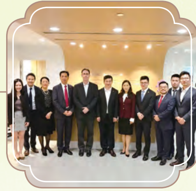
於5月與世界銀行集團成員公司 國際金融公司訂立不超過 200,000,000美元的貸款融資協議