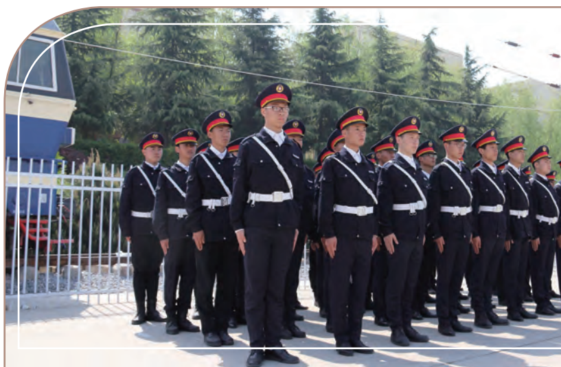
學校禮儀隊訓練中，西安鐵道學院

於2018年9月（本報告期之後），收購松田大學及松田學院的事項已妥為完成。轉讓股權及松田公司（松田大學的100%聯席舉辦人及松田學院的100%舉辦人）的董事會成員及法定代表人變更均已完成並於中