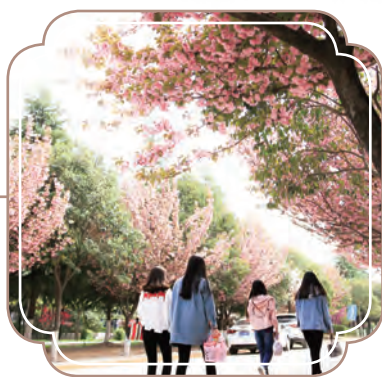
完成收購西安鐵道學院