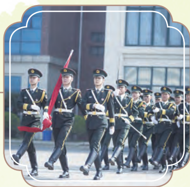
完成收購鄭州城軌學校