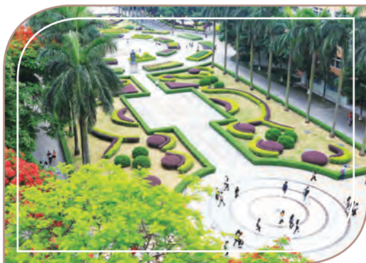
上圖：白雲技師學院