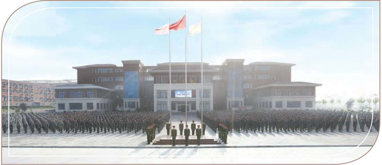
新生軍訓，鄭州城軌學校