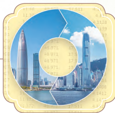
獲選為深港通合資格股票