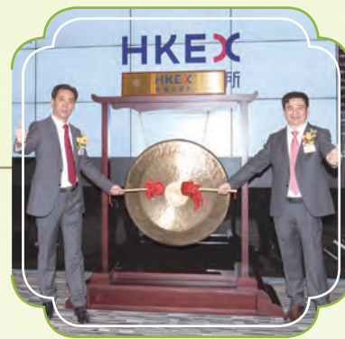
於香港聯合交易所有限公司上市