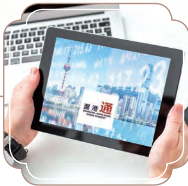
獲選為滬港通合資格股票