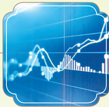
獲納入恒生綜合指數成份股及其旗下的小型股指數成份股以及恒生消費品製造及服務業指數