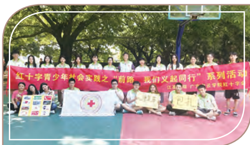
紅十字協會，廣東白雲學院