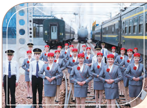
鐵道乘務培訓，鄭州城軌學校

在國家宏觀政策引導及扶持下，中國軌道交通在「十三五」期間進入蓬勃發展時期。隨着中國高速鐵路、地鐵、城際鐵路以及民用航空的高速發展，我們預期就業市場對鄭州城軌學校及西安鐵道學院畢業生需求強勁。