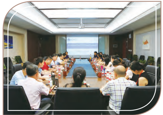
839大學培訓中，2018年夏天

於2018年7月，839大學為56位財務與採購人員進行了財務培訓。於2018年7-8月期間，839大學為56位教學管理人員進行了教學質量培訓。