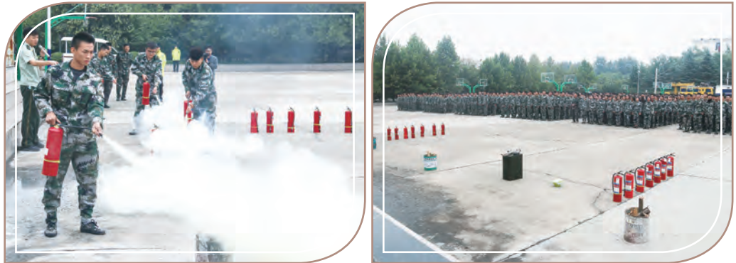
西安鐵道學院為5,000多名學生進行大型消防演習

二是設立的安全衛生督查項目；加強重點區域和重點場所安全巡查，及時消除安全隱患。截至報告期末，本公司設立的安全衛生督查項目主要包括：安全衛生宣傳教育、安全隱患排查整治、安全用電管理、危險化學品管理、食堂食品及鍋爐安全管理、警務安保工作、醫務衛生管理、宿舍安全管理和校車安全管理、校園及周邊環境整治等。我們配備必要公共場所視頻監控設備，會為安全衛生督查項目配置好安全保衛人員，分工明確、責任到人。在校園環境方面，學校每週會對校園不同區域進行定期消毒工作，做好環境清潔衛生和疾病預防。另外每學期進行空調維護工作，同時嚴格執行禁煙規定，定期進行控煙檢查，以保證教職工和學生的健康以及避免任何危害校區安全事件的發生。