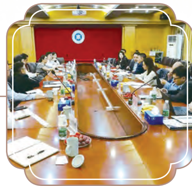
於6月與惠理集團合作以訂立人 民幣50億元的私募股權基金