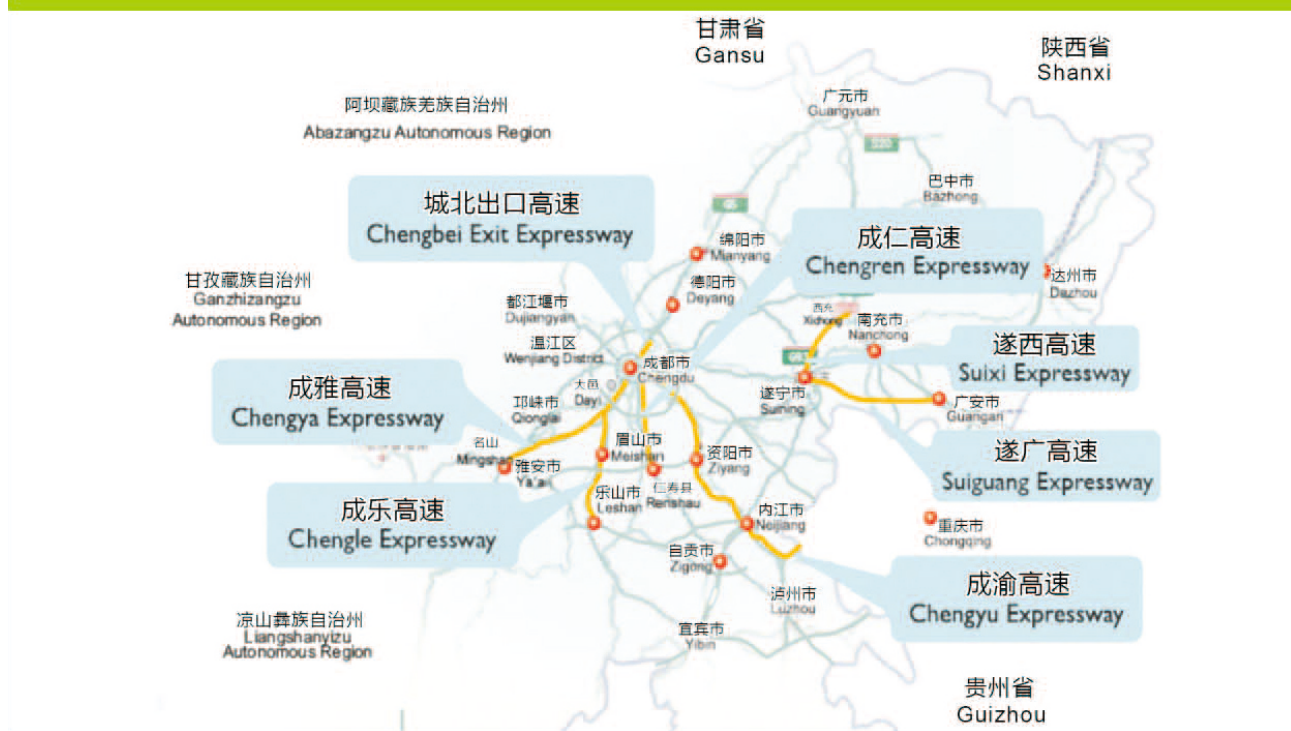
本集团辖下高速公路路网示意图

高速公路是國民經濟的基礎性、先導性產業之一，它不僅能夠滿足人民群眾快速出行的需求，還能有效促進經濟社會的發展。本公司通過投資建設及收購等方式獲得經營性高速公路資產，目前，擁有成渝高速、成雅高速、成樂高速、成仁高速、城北出口高速、遂西高速及遂廣高速等位於四川省境內的高速公路的全部或大部分權益，旗下高速公路總里程約744公里，占四川省高速公路通車總里程逾10%，在全省高速公路投資、建設及運營等領域均發揮著重要影響和作用。