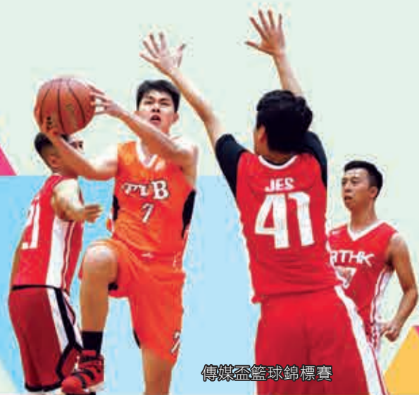
傳媒盃籃球錦標賽