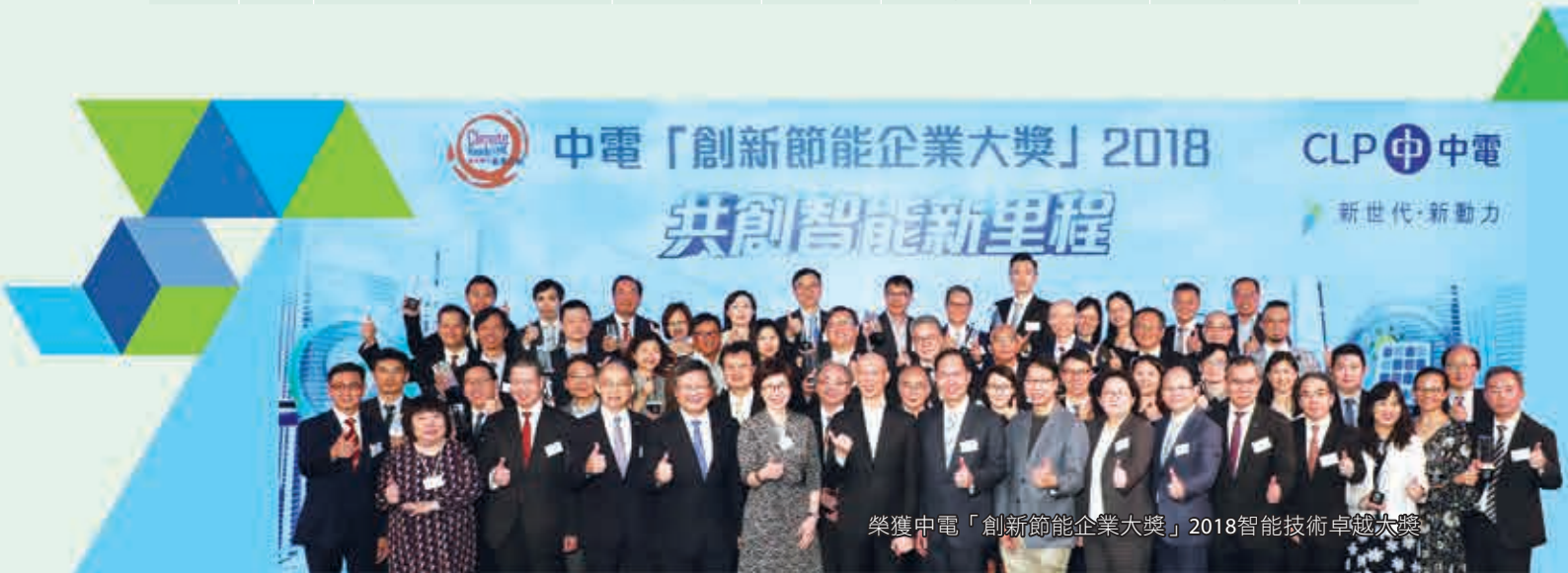
榮獲中電「創新節能企業大獎」2018智能技術卓越大獎