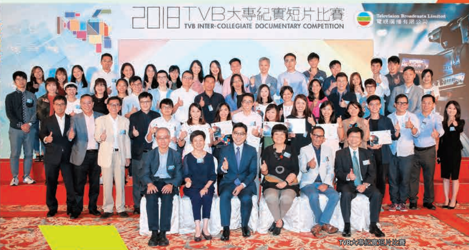
TVB大專紀實短片比賽