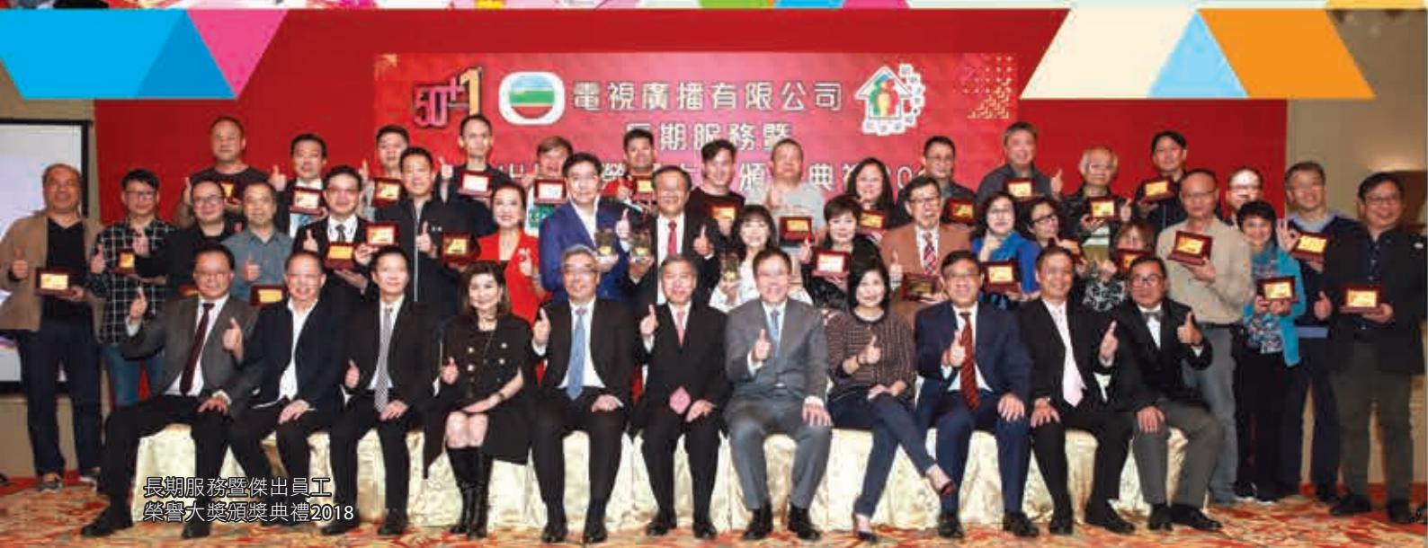
長期服務傑出員工 榮譽大獎頒獎典禮2018