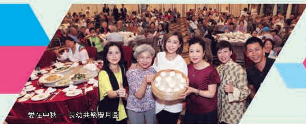
愛在中秋 — 長幼共聚慶月圓

我們對通訊局於二零一六年有關間接宣傳的兩項裁決而提出的司法覆核申請，案件已於二零一八年五月在高等法院審理。判決已押後作出。