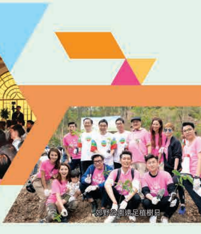
郊野公園遠足植樹日