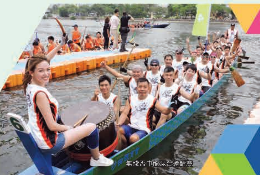
無綫盃中龍混合邀請賽

本公司遵守現有的法例，包括僱傭條例、僱員補償條例、最低工資條例、以及於僱傭方面的反歧視立法、資料私隱法例、行業規例及平等機會政策。