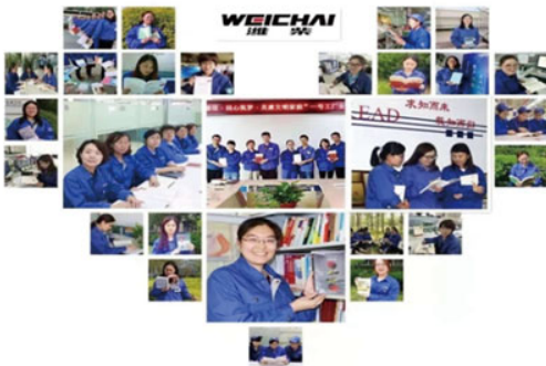
「引領女性閱讀·建設文明家庭」讀書活動