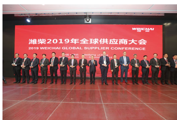
濰柴2019年度商務大會現場