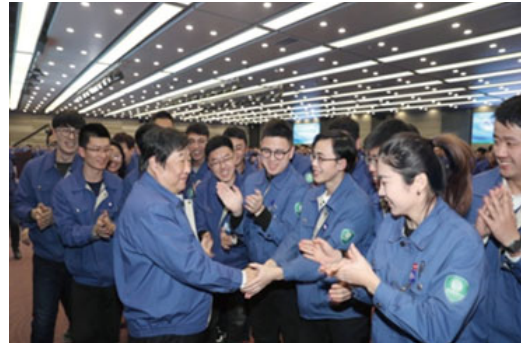
「激情成就夢想」青年員工交流會