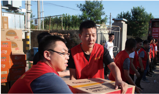
「情系災區，奉獻愛心」捐款活動

2018年8月，濰坊11個縣市區遭受嚴重洪災，公司組織「情系災區，奉獻愛心」捐款活動，得到廣大員工的積極響應，不到一天時間籌集救災款100多萬元，公司第一時間將100多萬元救災款送到受災群眾手中，幫助受災群眾一起進行災後重建工作。