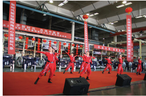
「攜手新時代 共築中國夢」慰問演出