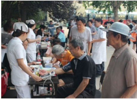
尊老愛老，服務老職工

全年走訪慰問老職工356人次；為79名離休幹部和老工人，辦理就醫醫院簽約、醫療證年審、藥費憑證收取、審核報銷；為117名遺屬發放生活困難補助金；為退休職工辦理慢性病證、醫療報銷。組織球類、瑜伽、誦讀、書畫展、攝影展、文藝演出等文化體育活動38場。讓廣大退休職工充分感受到了企業的關懷和幸福、參與感和獲得感。