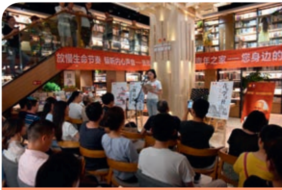
新華文軒·青年之家—「我是朗讀者」誦讀大賽

在傳承和弘揚中華文化的過程中，出版業發揮着極其重要的作用。四川省作為中華文化的重要發源地，歷史文獻典藏豐富，具有極高的出版潛力和出版價值，公司作為四川省重要的文化單位，肩負傳承巴蜀文化並對外弘揚中華文化的社會使命。