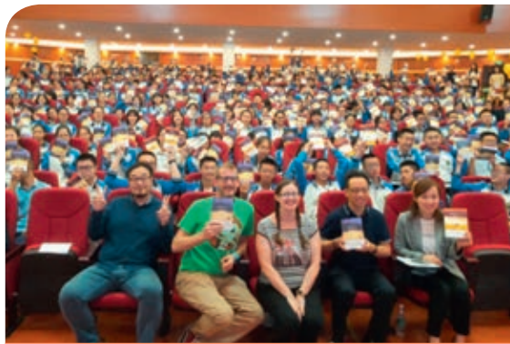
「新華文軒名家校園行」—《擺渡者》作者英國作家克萊爾成都行