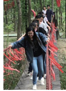
我們的團隊建設活動