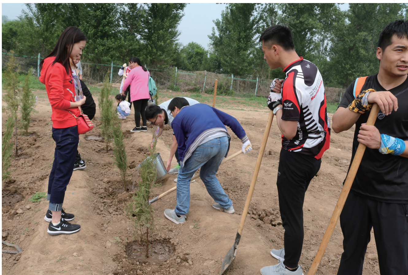
我們的員工在種植樹苗

於2018年5月，我們為員工及其家庭成員組織植樹活動，旨在增強彼等對氣候變化及環境污染問題的認識，且鼓勵我們的員工為保護環境而實踐綠色生活方式。