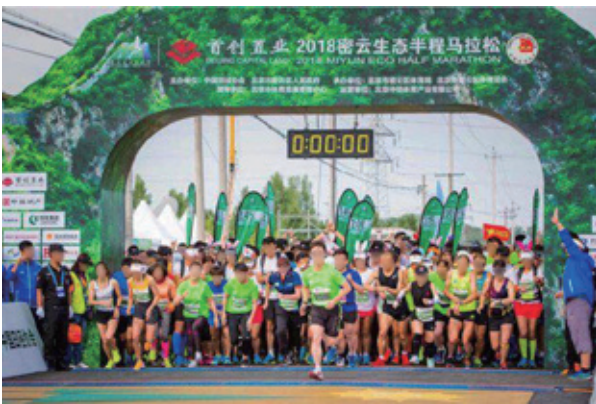
首創置業2018密雲生態半程馬拉松

一直以來，本集團積極倡導健康生活理念，並支持了一系列體育活動。2018年，本集團繼續支持了The Color Run活動。此外，2018年，本集團還支持了北京密雲生態馬拉松活動的舉行。該活動參賽選手逾5,000人，參賽者親友團、相關工作人員、志願者等近萬人。