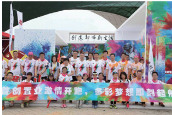
The Color Run