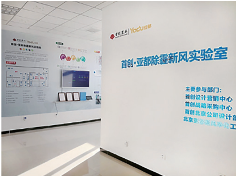
首創•亞都除霾新風實驗室

室內空氣質量一直是消費者們的關注重點，同樣也是本公司關注點。本公司致力於為業主、住戶提供健康的室內空氣。為此，本公司聯合北京亞都新風淨化工程技術有限公司成立了「首創•亞都除霾新風實驗室」，以進行「全屋好空氣」的除霾新風系統研究。目前，該系統已取得3項技術專利，具有空氣處理和混風節能雙重效果，將逐步在公司項目中進行推廣應用。