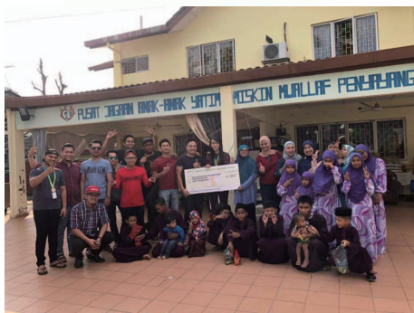
Persatuan Penyayang Nur Iman Kuala Lumpur & Selangor (Nur Iman Caring Society of Kuala Lumpur & Selangor)

本公司透過慈善活動，向員工籌得善款及物資價值合共馬幣20,000元，並於2018年6月9日交予非營利組織及慈善機構代表接收。