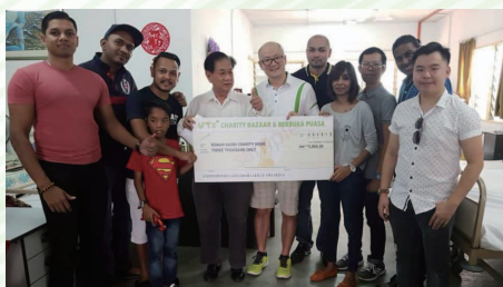
Persatuan Kebajikan Orang Terabai dan Warga Emas Rumah Kasih Kuala Lumpur (Welfare Society for the Homeless and Elderly of Kuala Lumpur)