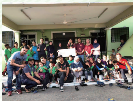
Pertubuhan Kebajikan Anak Yatim Al-Nasuha (Al-Nasuha Orphanage Welfare Organisation)