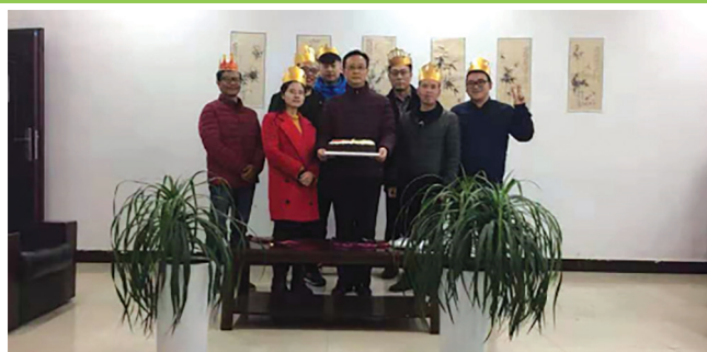
貴州學校工程學院員工生日會

本集團定期和不定期的舉辦員工生日會、新員工見面會和員工座談會等多種形式且內容豐富的員工活動。在各式各樣的活動中，員工能增進彼此的了解和友誼，於拉近了員工與公司的距離，有效促進員工的團隊凝聚力。本集團亦根據不同活動主題準備相應的員工福利、賀卡和活動紀念品。