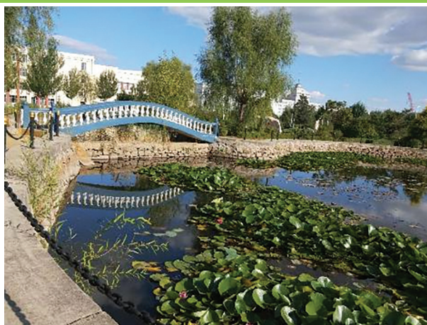
東北學校哈爾濱華德學院山水園

於本報告期內，雲南學校、貴州學校、東北學校和河南學校校園內超過5米高的樹木共有約17,485棵，參考香港聯交所附錄二《環境關鍵績效指標匯報指引》進行估算，2018年一共可以抵消本集團約402噸的二氧化碳排放，而2017年為357噸。