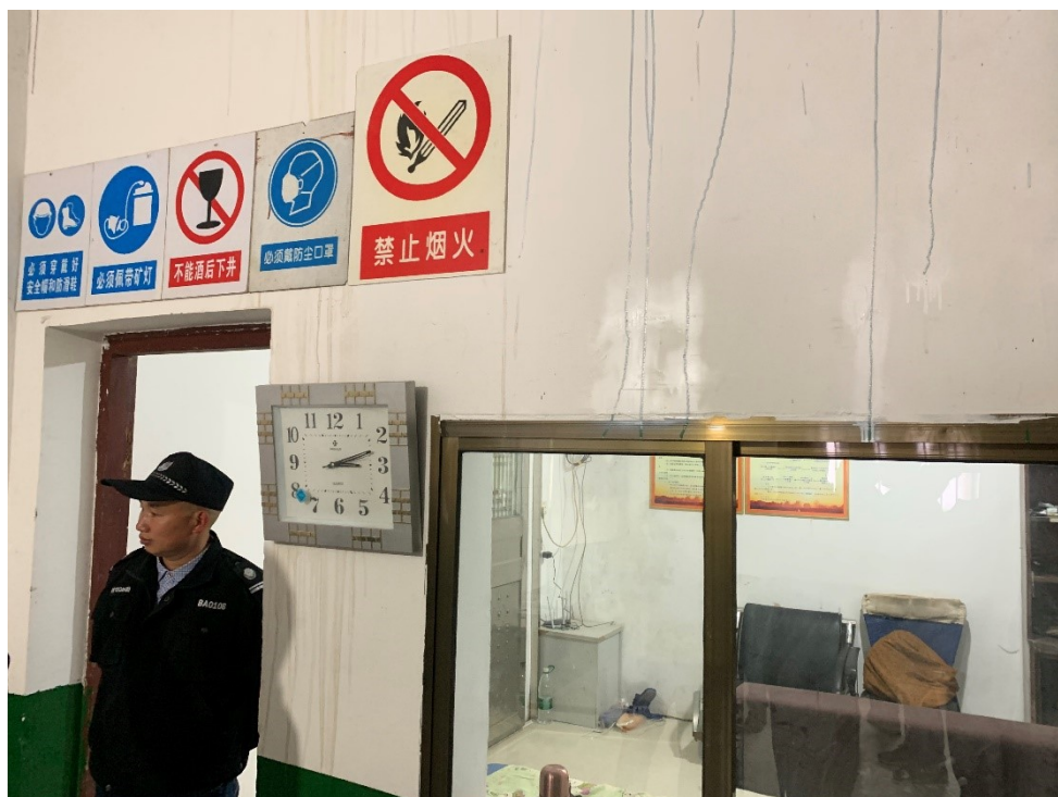
▲礦區內設置保安值班室並由保安員 24 小時值班

在採礦方面所面對的主要危害包括：(i) 排土作業；(ii) 地壓災害；(iii) 水害；(iv) 燃燒或爆破危害；(v) 中毒；及 (iv) 窒息危害。