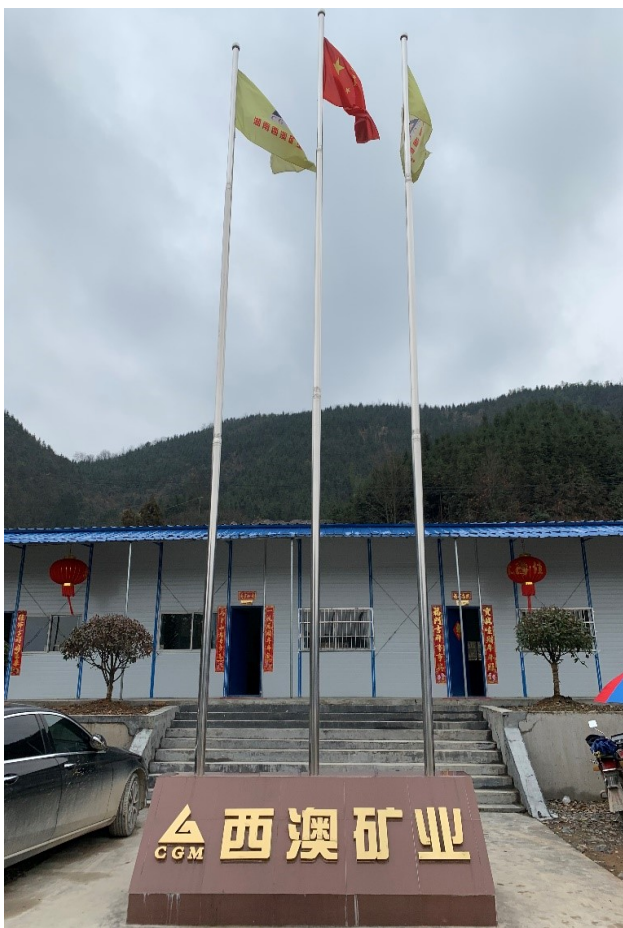
▲官莊金礦位於中國湖南省懷化市沅陵縣官莊鎮

本報告按照香港聯合交易所有限公司證券上市規則附錄 27 的環境、社會及管治報告指引編製，主要匯報本集團由 2018 年 1 月 1 日至 2018 年 12 月 31 日期間（「2018 年度」）的主要措施及活動。有關本集團的企業管治資料，請參閱本公司 2018 年度的年報。