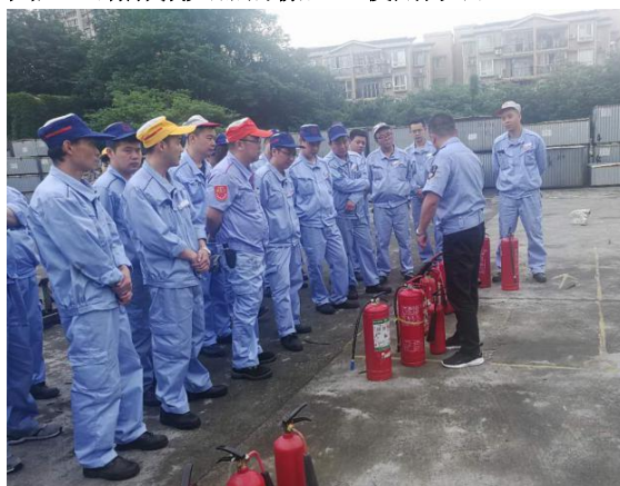
圖六 講解滅火器的檢查、使用方法