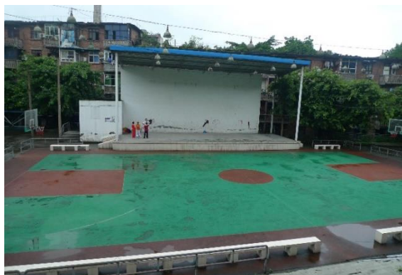
圖八 提供文化場地