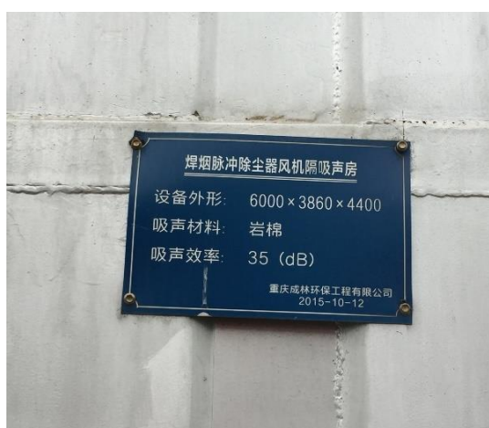
圖二 物理隔聲措施 - 吸聲房