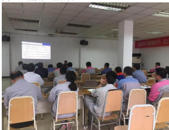
圖五 消防知識培訓