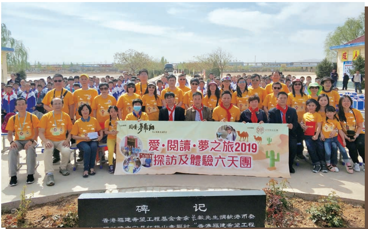
照片 5：員工與閱讀·夢飛翔文化關懷慈善基金於中國探訪弱勢兒童