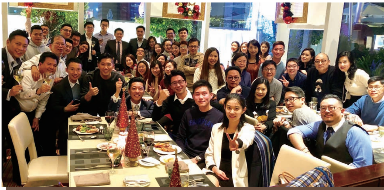
照片 1：與員工共同享用聖誕自助餐

為了解僱員之工作滿意度，我們建立了各種渠道與僱員溝通，包括新入職僱員研討會及與僱員進行離職面談。