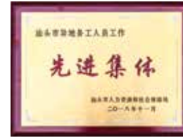
汕頭政府人力資源和社會保障局頒發