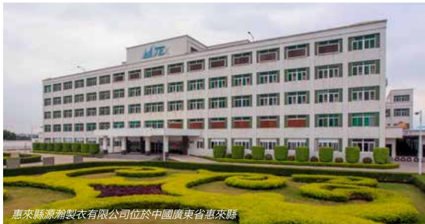
惠來縣源瀚製衣有限公司位於中國廣東省惠來縣