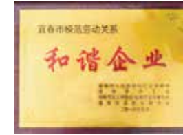
宜春市工商業聯合會頒發