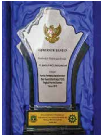
印尼萬丹省長頒發安全獎項

個人防護裝備(PPE)的使用守則已經制定。員工獲免費提供個人防護設備，及已接受教導正確佩戴的方法，以減少對健康的影響。防護裝備包括：防塵口罩（在切割區域）、金屬手套（用於裁剪操作）、護指器（安裝在特種衣車）、護目鏡（防止工作時的飛濺物）、耳塞（在繡花車間等高噪音區域）。部分廠區更為工人提供防護腰帶，防止在搬運重物時腰部或背部受傷。