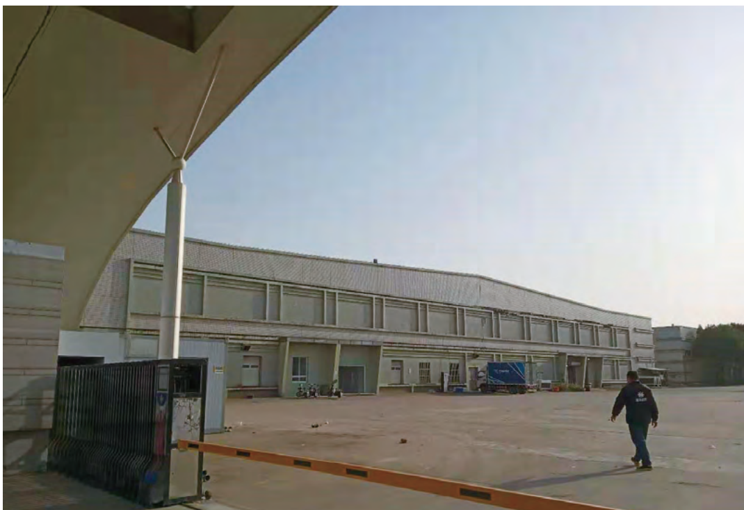
▲本集團位於無錫國家高新技術產業開發區的無錫基地

於2018年11月31日，本集團向獨立第三方出售了若干附屬公司，當中包括味碩實業（上海）有限公司（「上海味碩」）及其位於上海市松江區的先馳達物流倉庫（「松江基地」）。本集團期後把冷鏈食品貯存和物流業務轉移至本集團另一附屬公司，無錫颯達實業有限公司（「無錫颯達」）的物流倉庫（「無錫基地」）。由於松江基地及無錫基地是本集團於2019年度內主要的冷鏈食品貯存點，而食品冷鏈業務對能源消耗較大，故對環境、社會及管治相關性較高，所以本報告主要披露上海味碩及無錫颯達於2019年度的3個環境範疇及8個社會範疇之政策及相關表現。