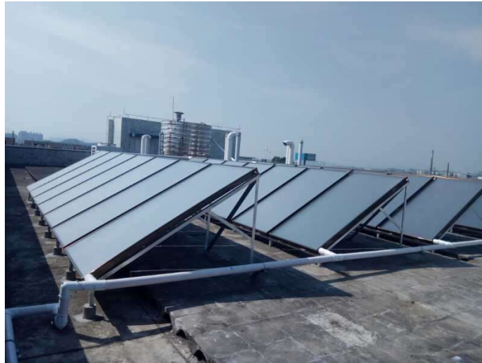
位於江門廠的太陽能集熱器