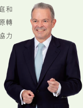
藍凌志 首席執行官

我完全理解你對環境的關注，而我可向你和其他青年人保證，中電不僅關心和認真對待這議題，更致力提供解決方案。毫無疑問，大氣中的溫室氣體水平正因人類活動而上升，為氣候帶來災害性的變化。中電是亞洲首家自願訂立減低業務活動碳強度目標的電力公司，並一直持續提升這些目標。你可以在本年報中了解到，我們已經不再投資新的燃煤發電資產，更會在2050年前淘汰現有項目。然而，能源轉型並非一朝一夕的事，過程中需要投資新的零碳排放電廠，以及把電力連接到各城市的輸電系統，而中電正為這方面的工作而努力。在這轉型期，我們必須細心規劃，確保供電不會中斷，為服務的社區提供可靠電力。醫院、運輸系統、數以百萬計的家庭和企業都依賴電力。因此中電倡議社會各界共同協力慎密策劃，以成功管理能源轉型的過程。我們不單有積極求變的熱忱，更將貢獻我們的專業知識和經驗，協力提供解決方案。你們的未來，將有我們同行。