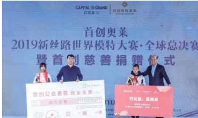
首創奧萊2019新絲路世界模特大賽全球總決賽的慈善捐贈儀式

除此之外，首創鉅大及旗下各項目公司亦積極組織員工開展愛心捐款、植樹造林等活動，包括：