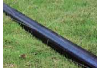
首創鉅大奧特萊斯商場的微噴滴灌設施