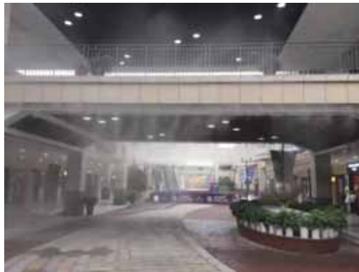
首創鉅大奧特萊斯商場的微噴設備

為響應國內多地的垃圾分類新規，2019年，首創鉅大總部及項目公司進一步優化辦公區及商區的垃圾收納及清運工作。我們按照各地要求分類收納，與具備相關資質的清運公司合作，從而更環境友好地處置我們在運營過程中產生的垃圾。所有奧特萊斯項目的餐飲商鋪均安裝了油煙淨化系統，以保證排放達標。此外，本年度在昆山奧萊項目試行降塵措施，通過增加微噴設備，既達到夏季降溫效果，同時具備降塵效應。