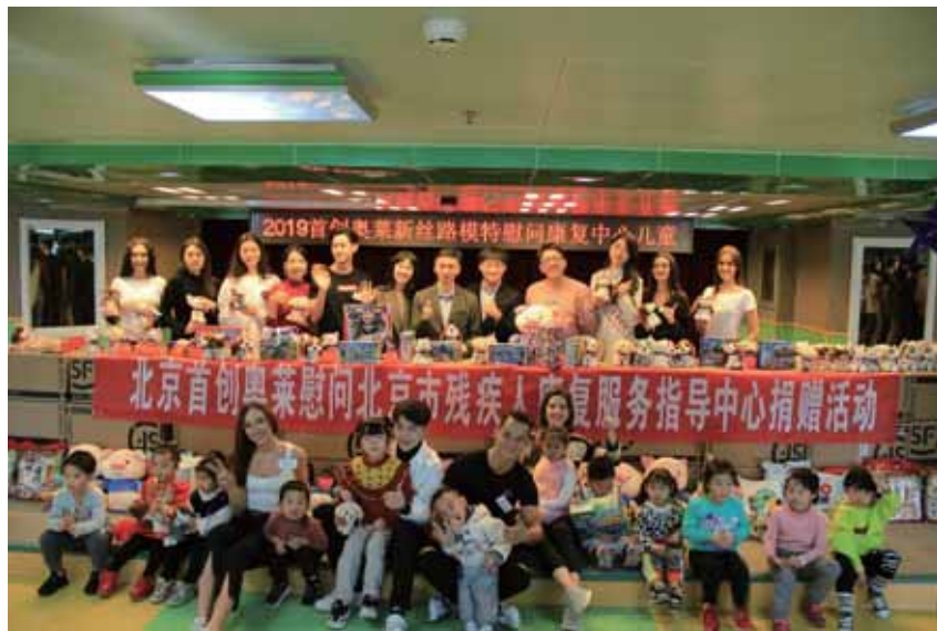
新絲路模特看望北京市聾兒康復中心的孩子們

2019年，以提倡時尚、健康生活理念，幫助青年人搭建實現超模夢想的橋梁為初衷，首創奧特萊斯總冠名2019年新絲路世界模特大賽，與新絲路集團攜手將世界模特大賽落地商業購物場景，為年輕夢想締造展示舞臺。在活動之餘，我們亦積極推動公益與時尚結合，鼓勵青年力量匯入社會善舉，組織決賽參賽選手參與首創奧萊公益慈善項目。選手們與首創鉅大員工共同看望北京市殘疾人康復服務指導中心的患兒，給孩子們帶去精心挑選的玩具、零食，送給他們成倍的愛和濃濃的溫情。在2019年新絲路世界模特大賽全球總決賽上，由首創集團、首創置業，以及首創鉅大聯合發起慈善捐贈環節，這一活動集合了300多家首創奧萊合作品牌等社會各方之力，為房山區婦聯「困難婦女兒童緊急救助項目」的25個困難家庭捐贈善款，為成都首創小學捐贈善款及300本愛閱圖書，為北京聾兒康復中心捐贈了學習用品及近千本愛閱圖書，並幫助12位北京聾兒康復中心的小朋友走上築夢T台，鼓勵「聽障兒童」一起共享世界精彩。