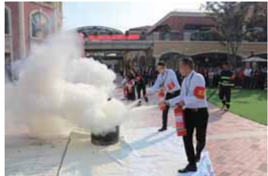
首創鉅大奧萊特斯項目消防演習現場