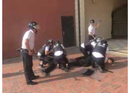
奧萊特斯項目安全應急演練現場