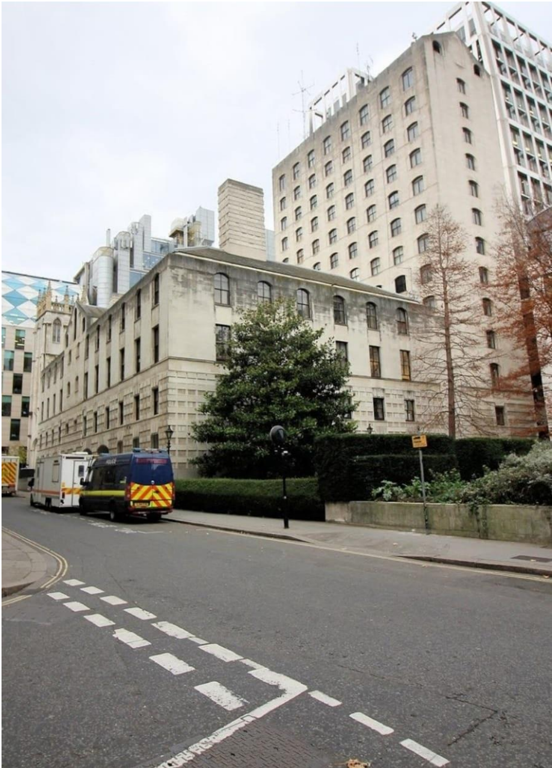
英國倫敦 EC2 區木街(Wood Street) 37 號木街(Wood Street)警察局總部