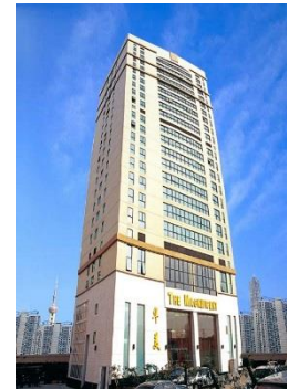
上海華美 國際酒店