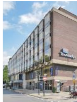
位於倫敦之 Royal Scot Hotel