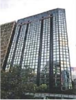
最佳盛品酒店 尖沙咀