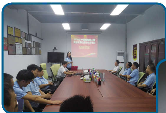
線整改專案表彰儀式