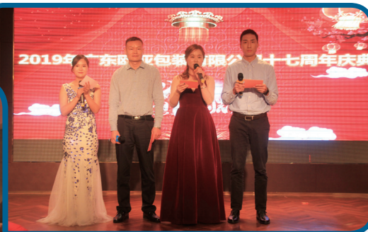
本集團17週年慶典晚會