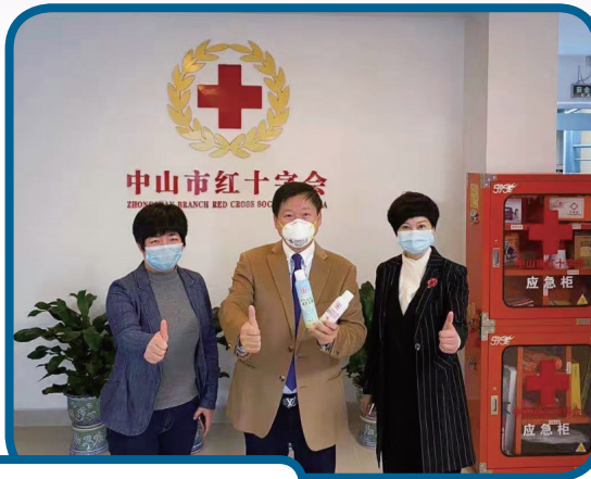
向中國紅十字會捐贈消毒用品