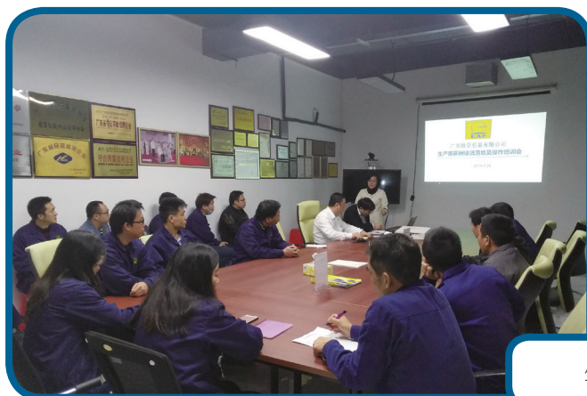
生產部薪酬績效系統培訓