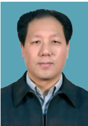
何文 董事會秘書、聯席公司秘書

馬江黔，51歲，無曾用名／別名，正高級經濟師，現任本公司總經濟師。2013年1月至2014年6月任中鐵六局集團有限公司總經理、黨委副書記、董事，2014年6月至2018年6月任中鐵六局集團有限公司總經理、黨委副書記、副董事長，2018年6月至今任本公司總經濟師。